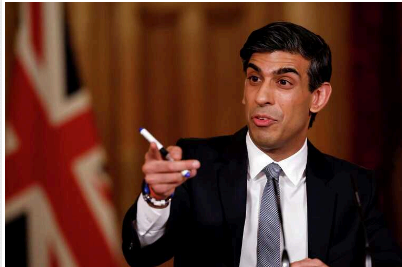
Партії Сунака пророчать приголомшливу поразку на виборах у Великобританії

Консервативну партію прем'єр-міністра Великої Британії Ріші Сунака очікує приголомшлива поразка на виборах цього року. Лейбористи можуть отримати 385 місць у парламенті, тоді як консерваторам вдасться зберегти лише 169 місць.