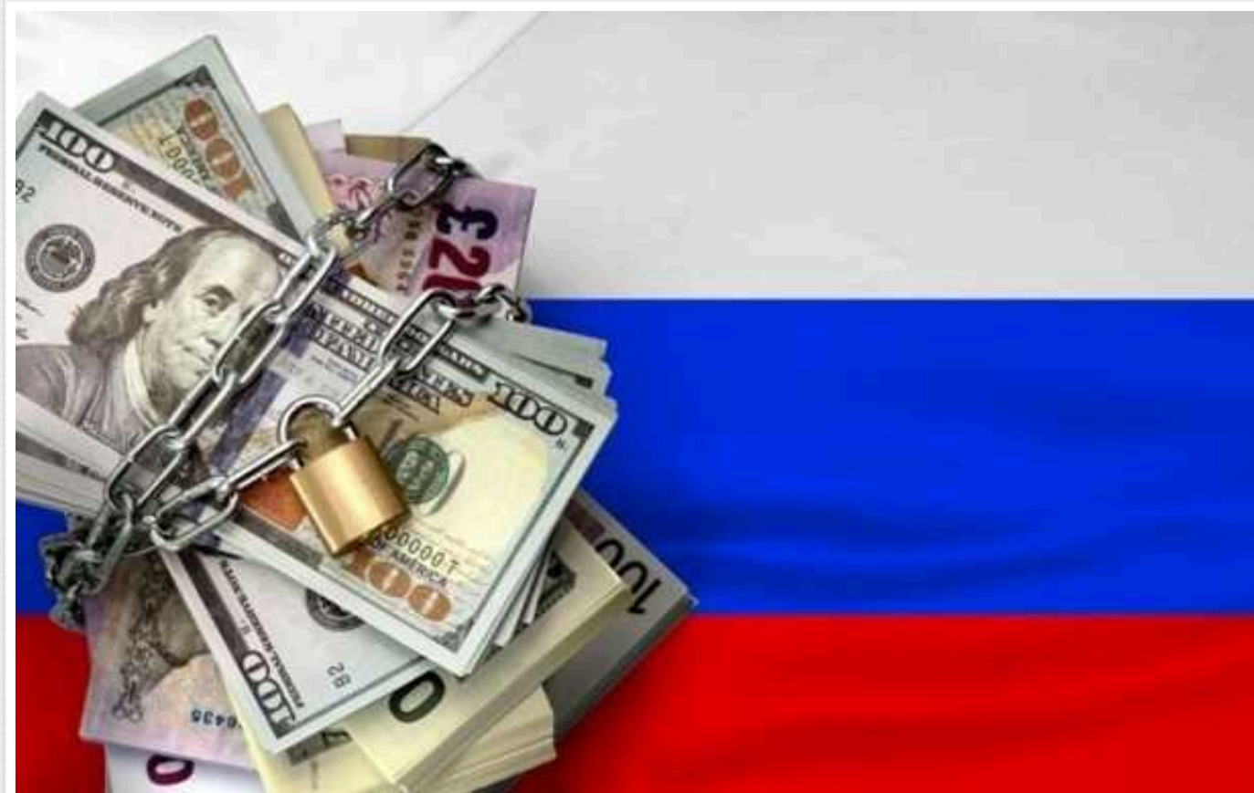
Глава Комітету з фінансів закликає розглядати глобальні компенсації від РФ за втрати внаслідок війни в Україні

Якщо не конфіскувати в Росії заморожені на Заході активи, вийде, що за розв'язану нею в Україні повномасштабну війну платять цивілізовані народи, а не самі росіяни. Тому міжнародне співтовариство має вийти на чіткий юридичний механізм, який забезпечить такі глобальні довгострокові компенсації.