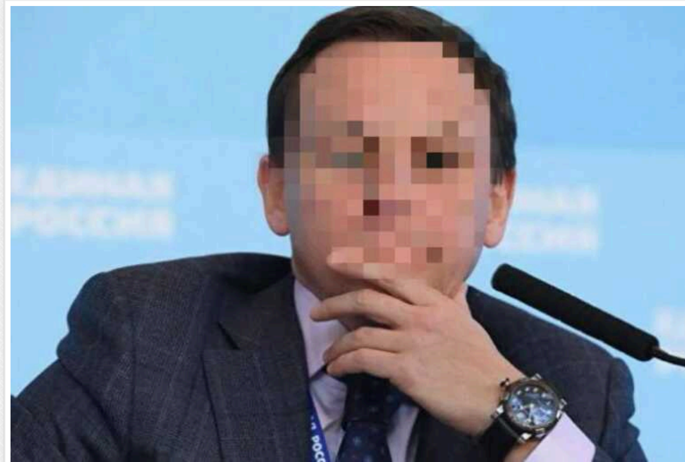
В Україні оголосили підозру "смотрящому" від партії Путіна: координував псевдореферендум у Херсонській області

Депутату Держдуми РФ, підсанкційному Олександру Сидякіну Служба безпеки України оголосила підозру у посяганні на територіальну цілісність і недоторканність України. Саме цей "смотрящий" від партії кремлівського диктатора Володимира Путіна курував псевдореферендум на Херсонщині.