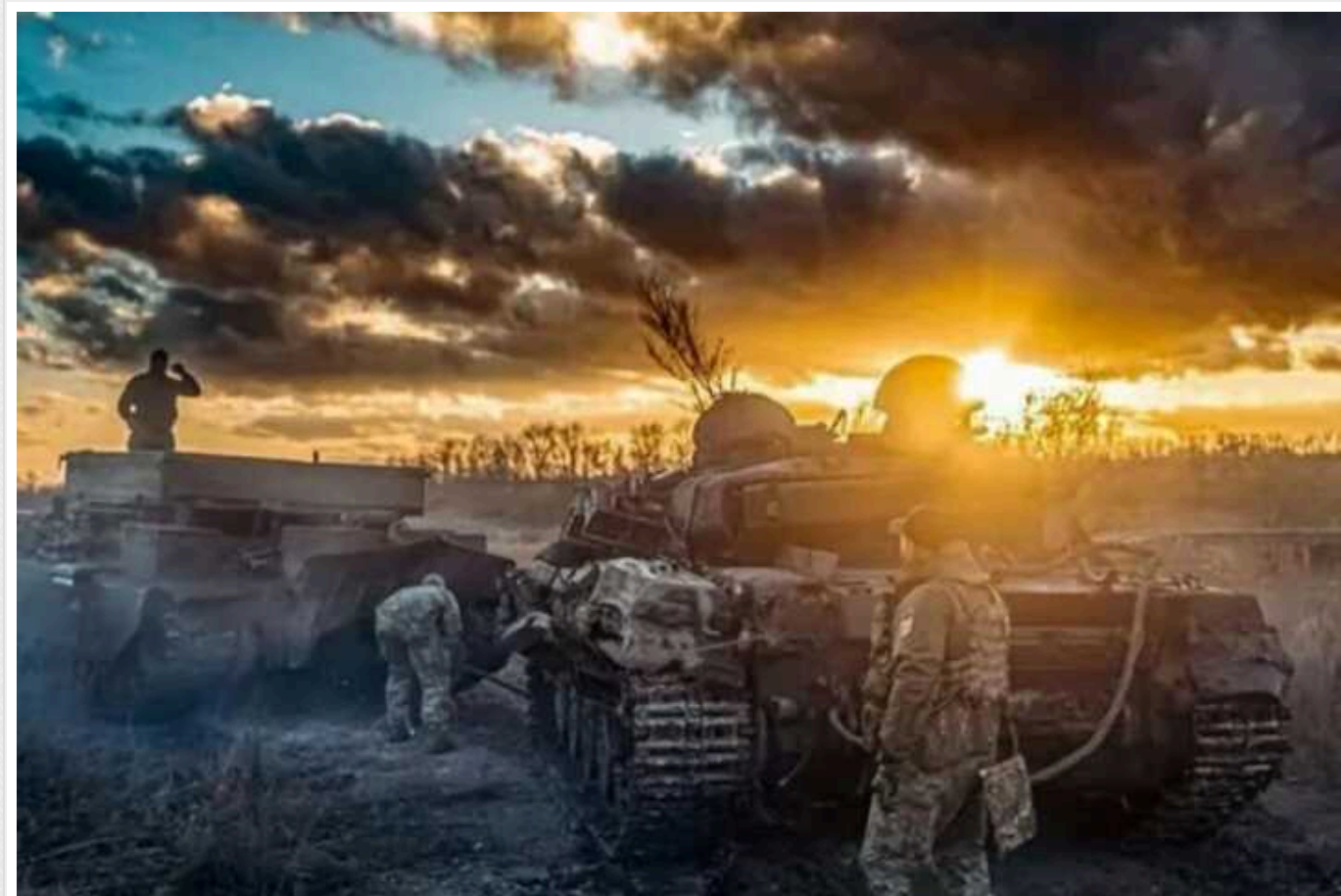
Ситуація на фронті: ЗСУ успішно відбили штурм загарбників і продовжують утримувати плацдарми на лівому березі Дніпра

Ворог не полишає спроб вибити українські підрозділи із плацдармів на лівобережжі Дніпра. Протягом 691-ї доби повномасштабного вторгнення ворог здійснив черговий безрезультатний штурм позицій наших військ, але українські захисники його відбили та продовжують утримувати плацдарми.