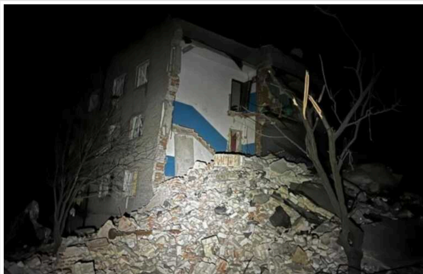
Окупанти завдали ракетного удару по Нью-Йорку в Донецькій області: є постраждалі, під завалами перебувають люди

Російська армія сьогодні, 15 січня, завдала ударів по Нью-Йорку в Донецькій області. Унаслідок цього обвалився під'їзд багатопверхівки, постраждали люди.