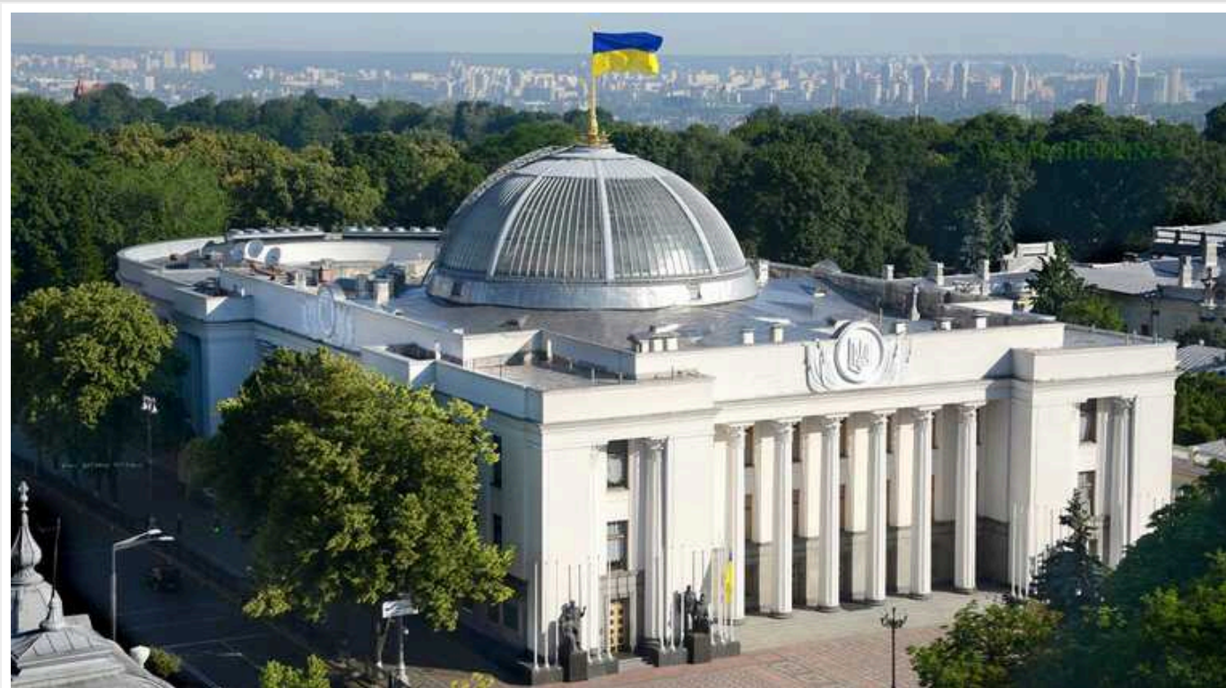
Внесення нової редакції законопроекту щодо мобілізації в Верховну Раду відбудеться не в найближчі дні, йдеться про тижні