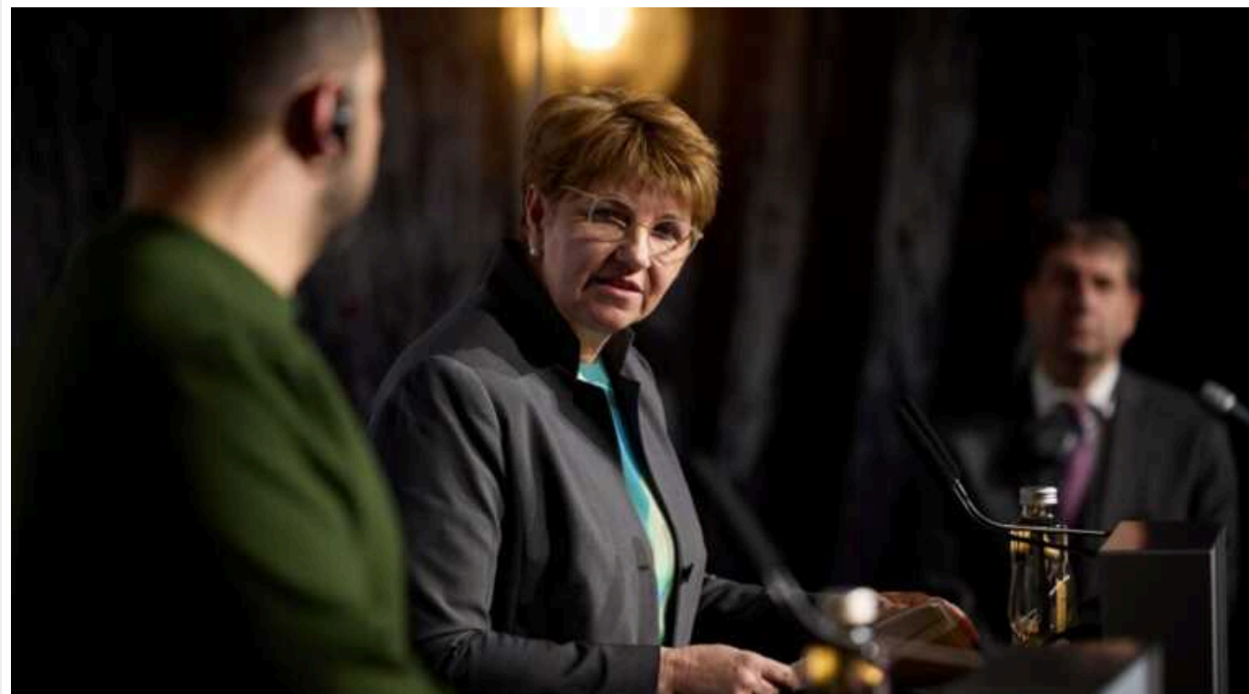
У Швейцарії відбудеться міжнародна конференція з розмінування України

У швейцарській Женеві у жовтні 2024 року відбудеться конференція з гуманітарного розмінування України.