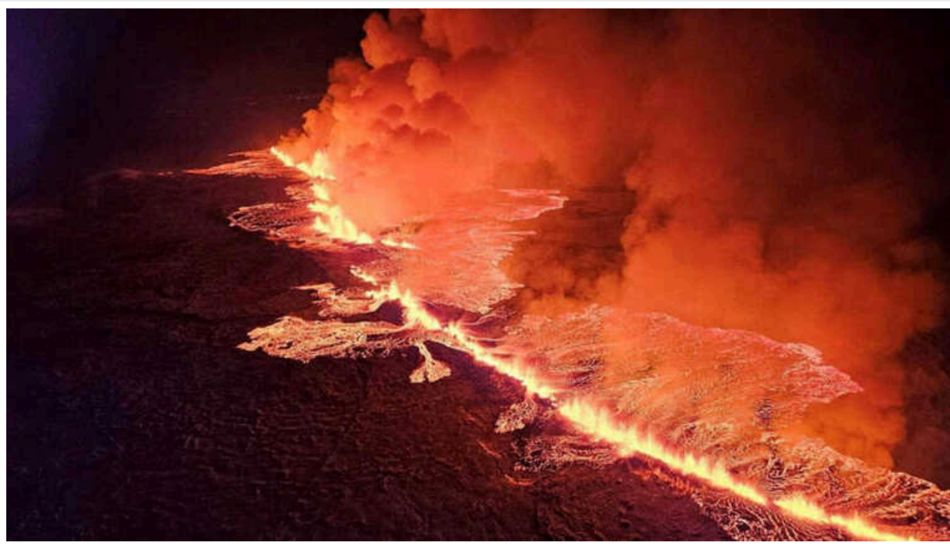
Вулкан в Ісландії зменшує свою активність

Влада Ісландії заявила, що станом на 15 січня вулканічна активність біля міста Гріндавік, яке довелось евакуювати через потоки лави, пішла на спад, хоча поки й не завершилась.