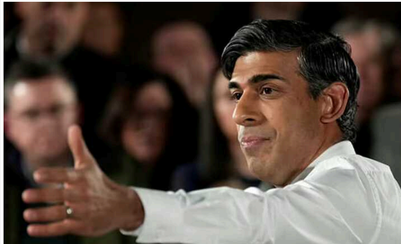
Прем'єр Британії у парламенті відмовився від терміну "безпекові запевнення" щодо угоди з Україною

Прем'єр-міністр Британії Ріші Сунак, виступаючи у британському парламенті не став вживати терміну "безпекові запевнення" щодо угоди з Україною.