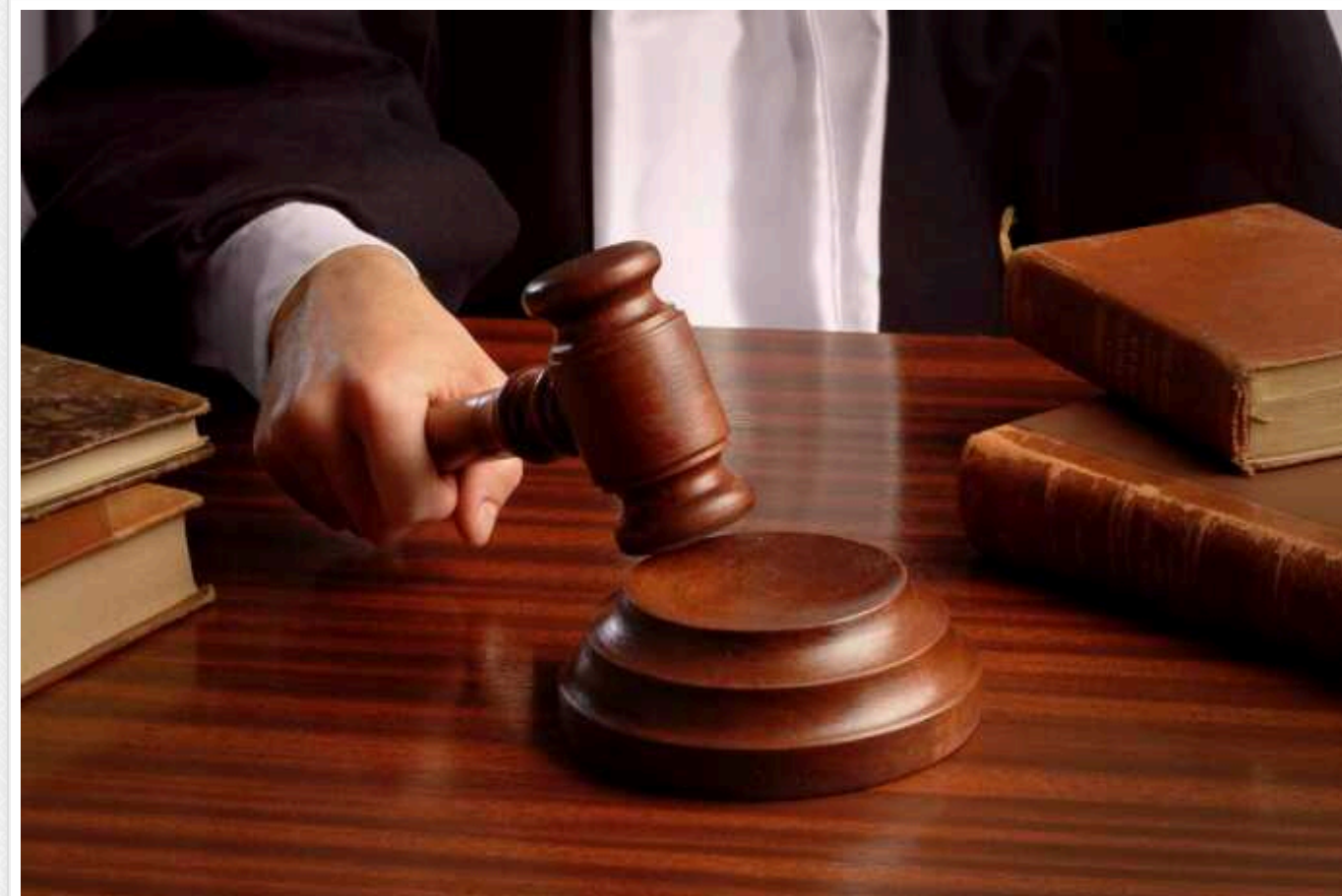
Глава ВАКС Михайленко стверджує, що варіанти мобілізації чи укладання контракту на військову службу використовуються як засіб ухилення від участі у кримінальному провадженні

Подєкуди особи мобілізуються наприкінці судового розгляду.