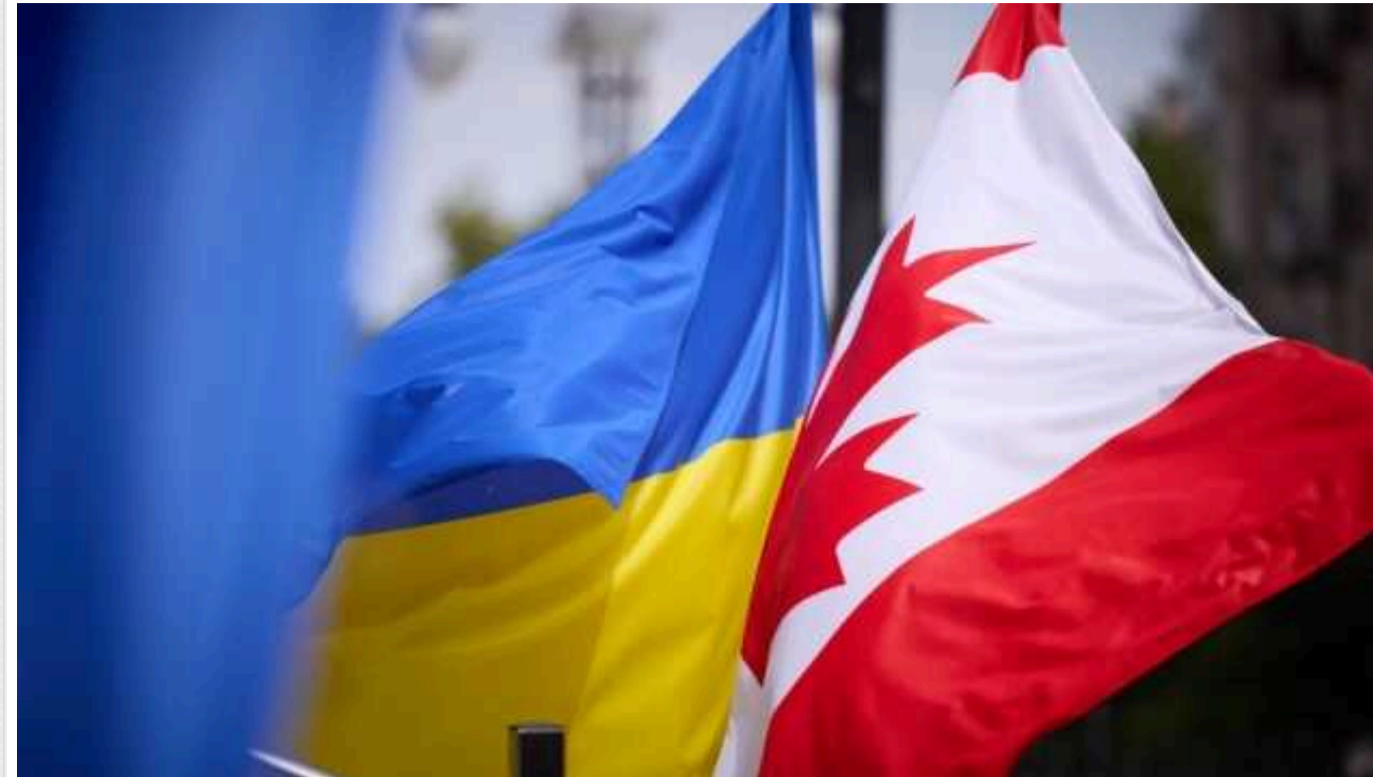
Канада надіслала Україні проєкт безпекової угоди - посол Канади Цмоць

Канада вислала Офісу Президента України проєкт безпекової угоди, щоб за наступні кілька тижнів мати детальний договір.