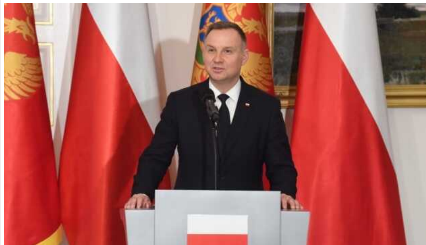
Польща готова поборотися за ключові посади в ЄС - Дуда

Варшава готова поборотися за отримання ключових посад в ЄС після цьогорічних виборів до Європарламенту, попри те, що нещодавно президентом Євроради був чинний прем'єр Польщі Дональд Туск.