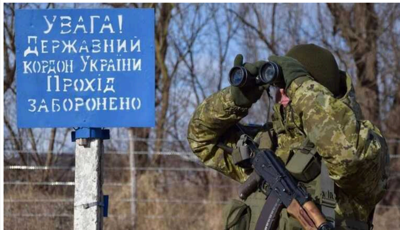
Прикордонний спецрежим в Україні: кого торкнуться зміни

В Україні змінили правила перебування у прикордонній смузі – тепер для цього необхідно мати спеціальний дозвіл.