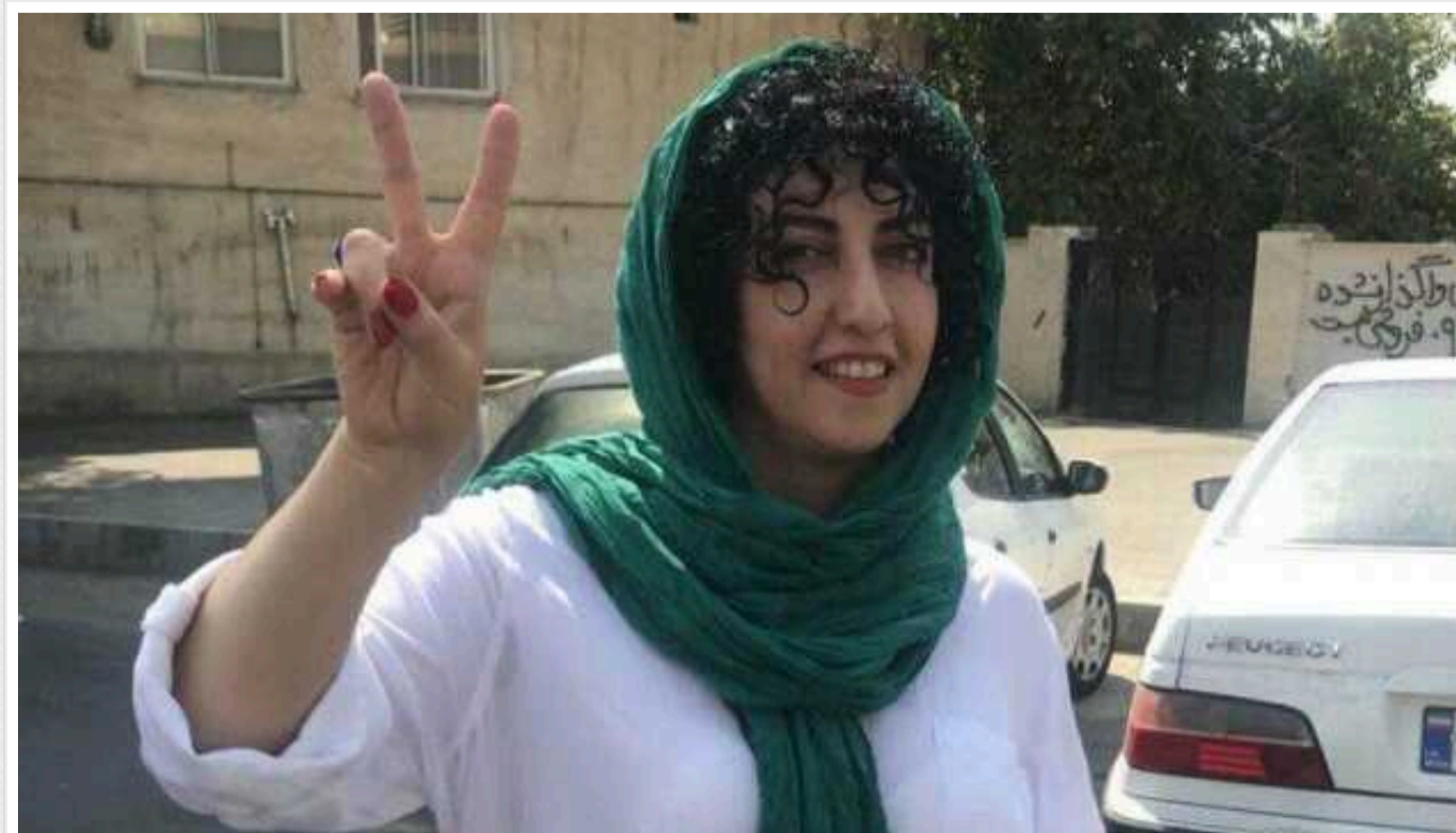
В Ірані ухвалили ще один вирок ув'язненій нобелівській лауреатці Наргес Мохаммаді

Суд Ірану ухвалив ще один обвинувальний вирок ув'язненій лауреатці Нобелівської премії миру Наргес Мохаммаді.