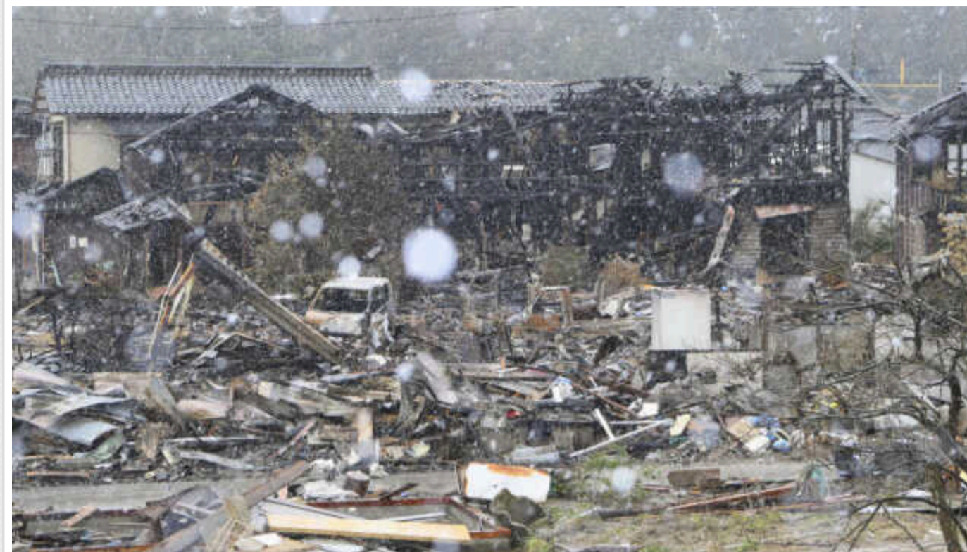
Землетрус в Японії: кількість жертв зросла до 222

Кількість жертв потужного землетрусу в Японії, що стався 1 січня, зросла до щонайменше 222 осіб.