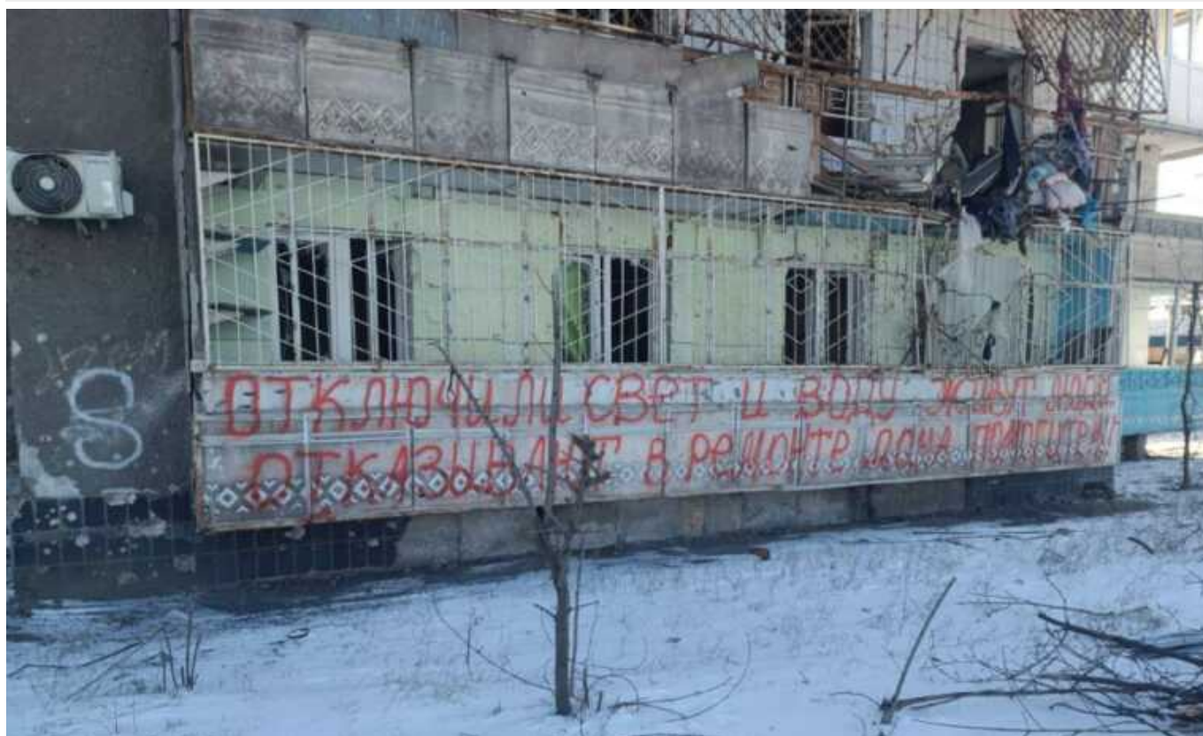
В окупованому Маріуполі загарбники зносять будинки, в яких мешкають люди