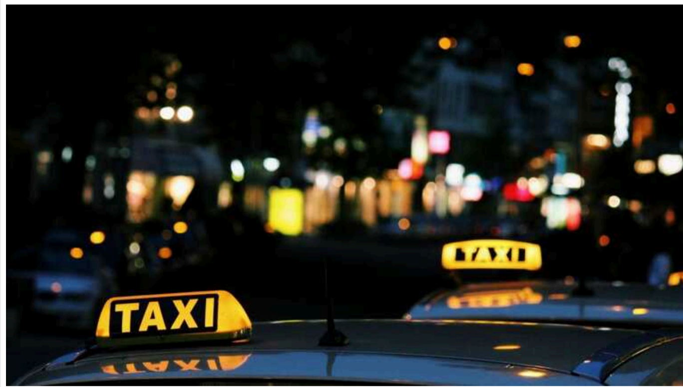
У Києві помітно зменшилась кількість водіїв таксі

Виклик таксі у Києві у звичайний час, не враховуючи години пік чи повітряні тривоги, займає значно більше часу, ніж навіть рік тому.