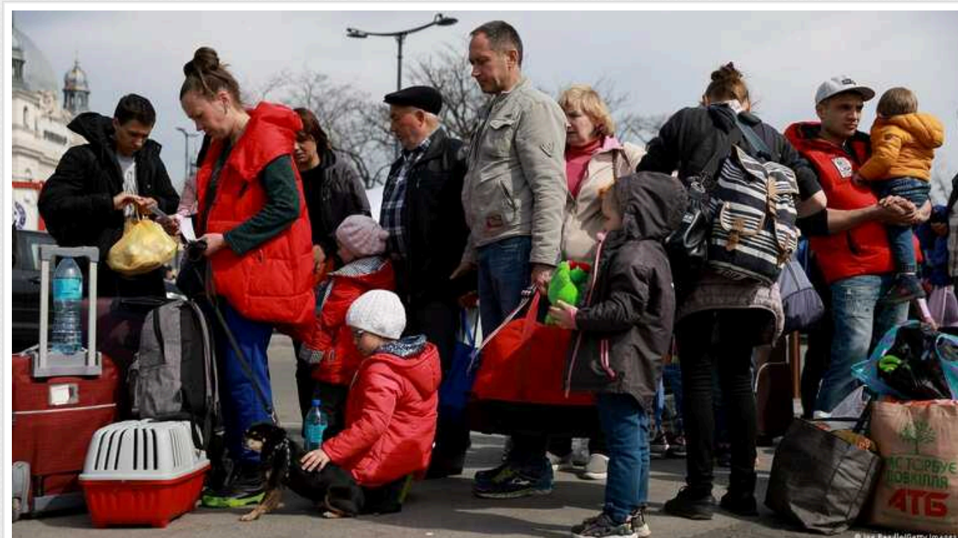
У Польщі допустили просування російської армії в Україні та нову хвилю мільйонів біженців