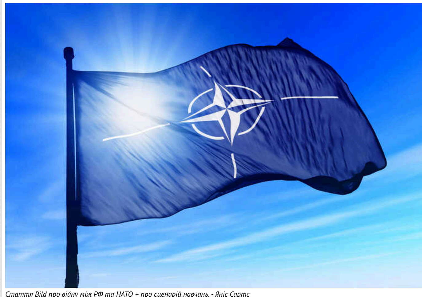
Стаття Bild про війну між РФ та НАТО – про сценарій навчань, - Яніс Сартс

Матеріал німецького тижневика Bild про те, що НАТО готується до війни з Росією, ґрунтується на документі, який є навчальним сценарієм.