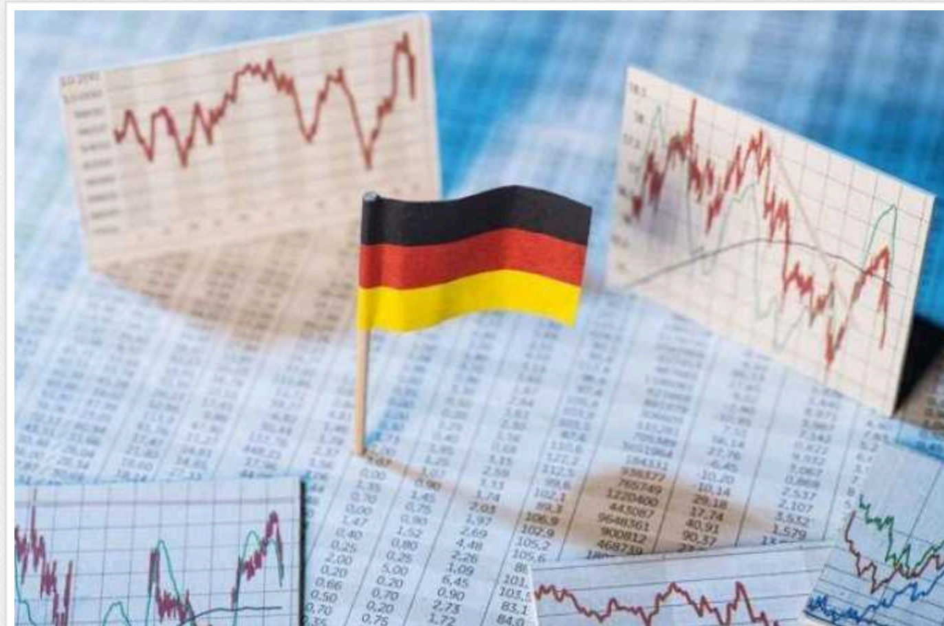
Німецька економіка пішла в мінус уперше з часів коронавірусної кризи

Як повідомляє Bild із посиланням на дані Федерального статистичного управління, ВВП ФРН у 2023 році зменшився на 0,3%.