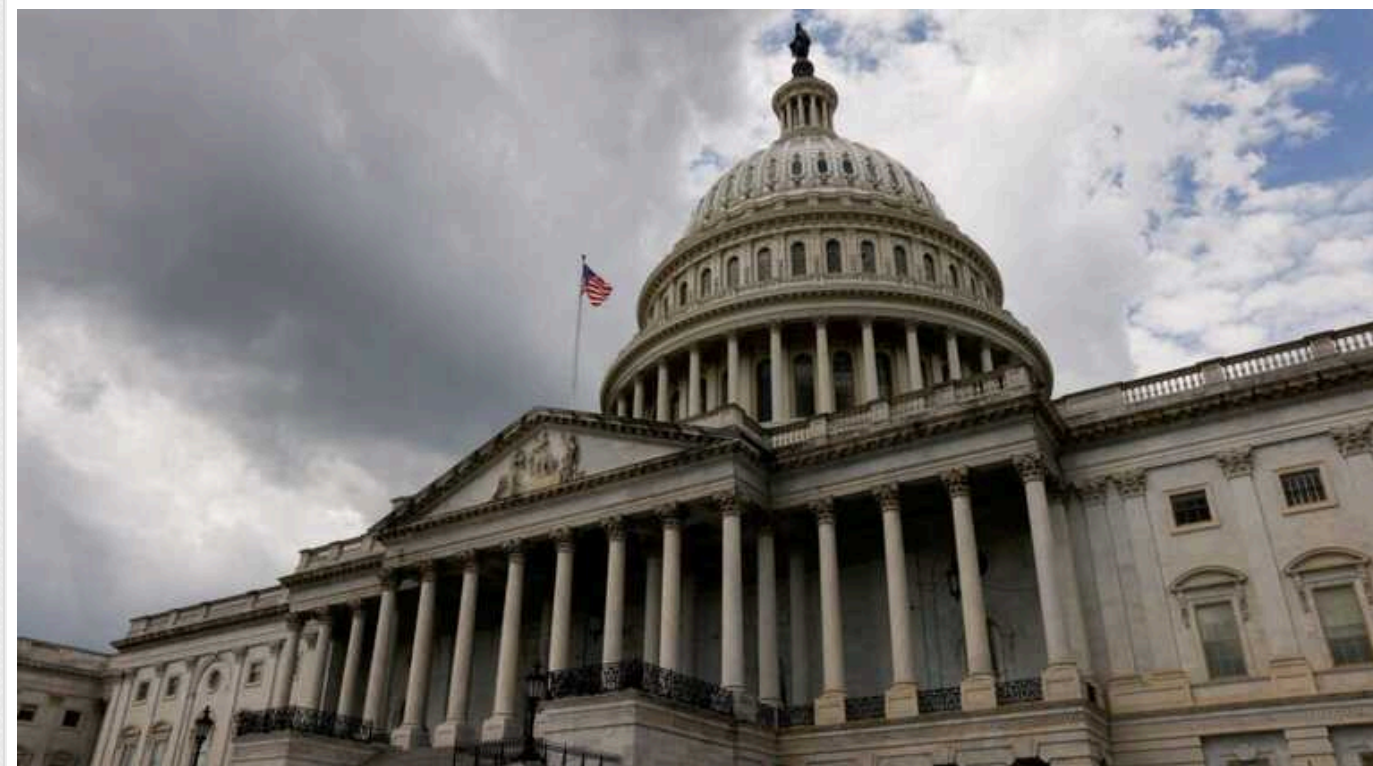
Ветеранська спільнота України закликала Конгрес США не зволікати з фінансовою підтримкою у боротьбі з Росією

Ветерани російсько-української війни звернулись до членів Конгресу Сполучених Штатів Америки з проханням пришвидшити надання Україні фінансової допомоги. Представники громадських організацій та спілок звертають увагу конгресменів на посилення ракетних ударів ворога по цивільним об'єктам і необхідність зміцнення обороноздатності країни.