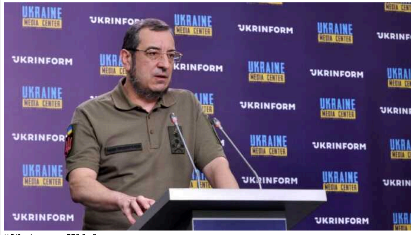
У ГУР оцінили стан ППО Росії

Росія під час війни перекинула до Москви та окупованого Криму системи ППО з Далекого Сходу та Північного регіону. Але потужність захисту не завжди відповідає заявам агресора.