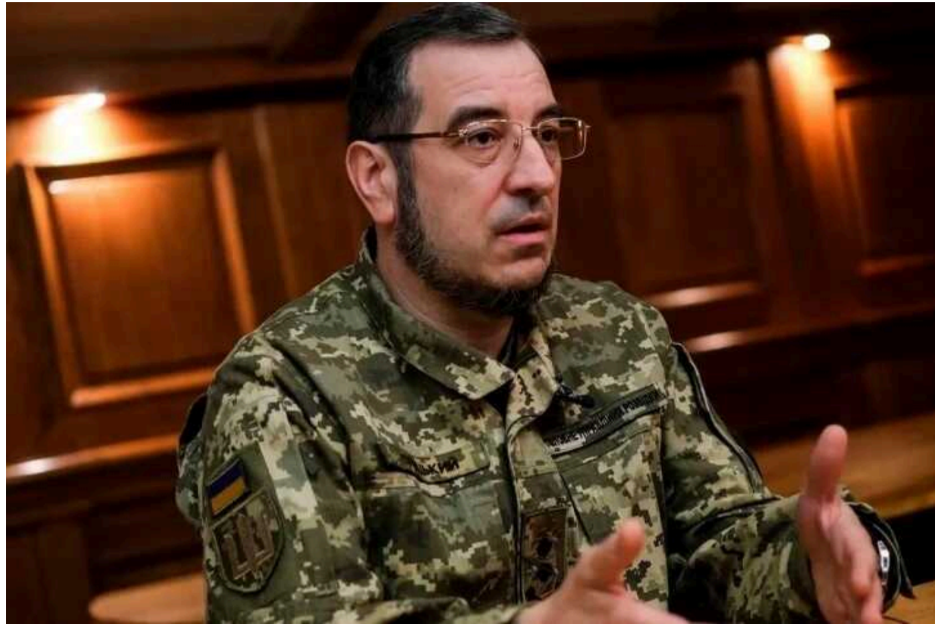
До російської армії щодня приходять близько тисячі людей, – Скібіцький

До Збройних сил Росії, шляхом мобілізації та підписання контрактів, щодня приходять близько 1000-1100 осіб.