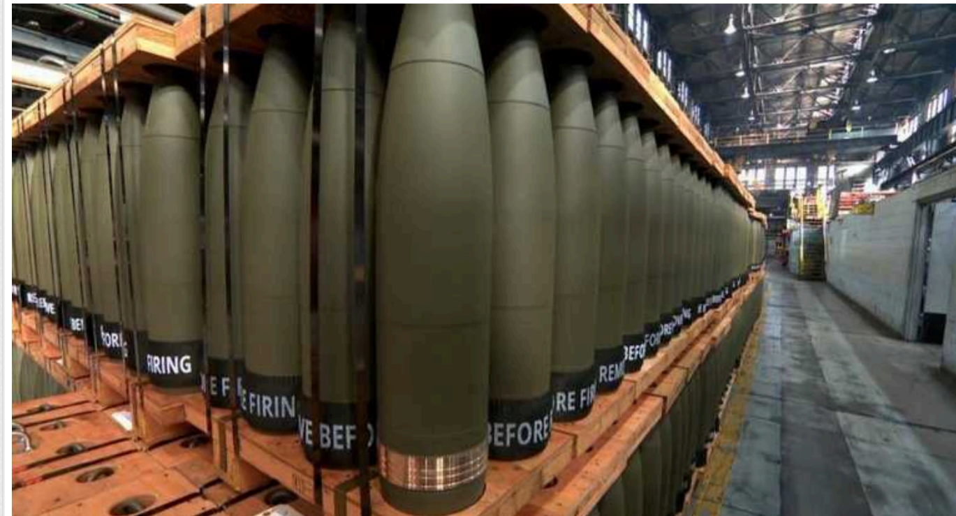
Rzeczpospolita: Польські заводи йдуть на війну. Виробництво боєприпасів йде повним ходом

Видання пише, що початок війни в Україні та різке зростання попиту на вибухівку змусили завод у Бидгощі Nitro-Chem збільшити виробництво тротилу до максимального рівня.