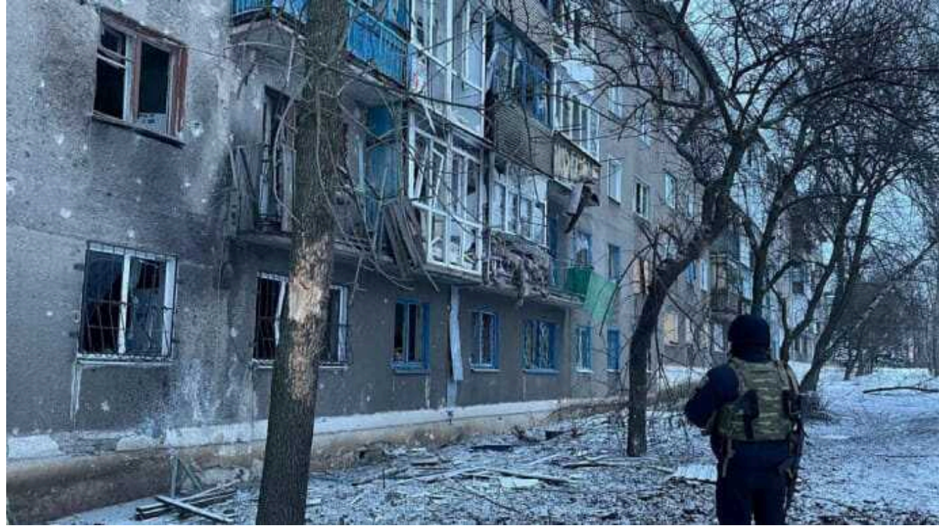
За два тижні окупанти скинули на Авдіївку близько 250 авіабомб

Російські терористи за перші два тижні 2024 року скинули близько 250 авіабомб на Авдіївку на Донеччині.