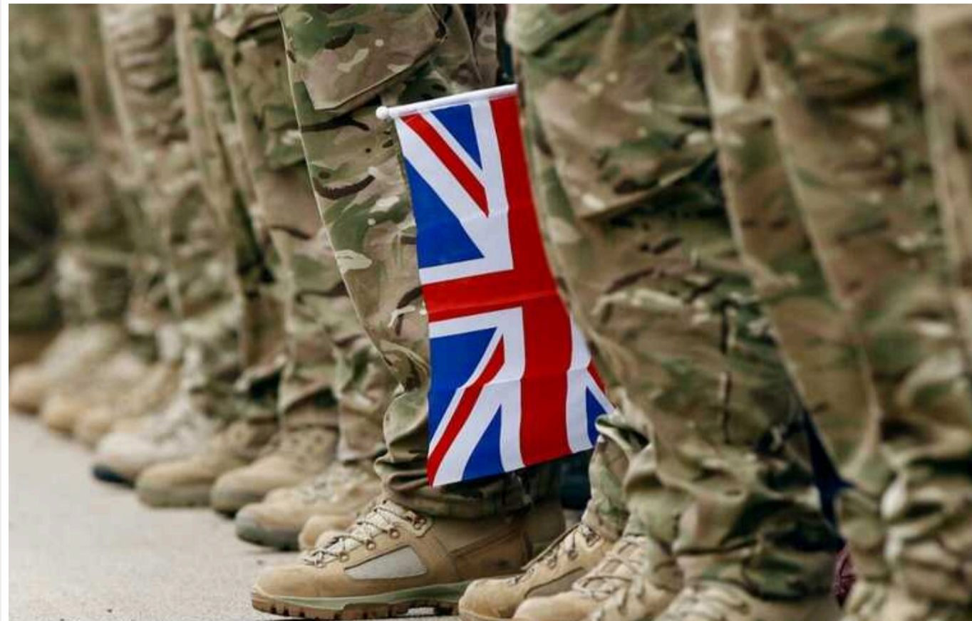
Велика Британія відправить 20 тисяч військових для участі у навчаннях НАТО в Європі

У першій половині цього року Велика Британія відправить 20 000 військовослужбовців для участі в навчаннях НАТО Steadfast Defender 24 в Європі. Також будуть направлені військові кораблі та винищувачі.