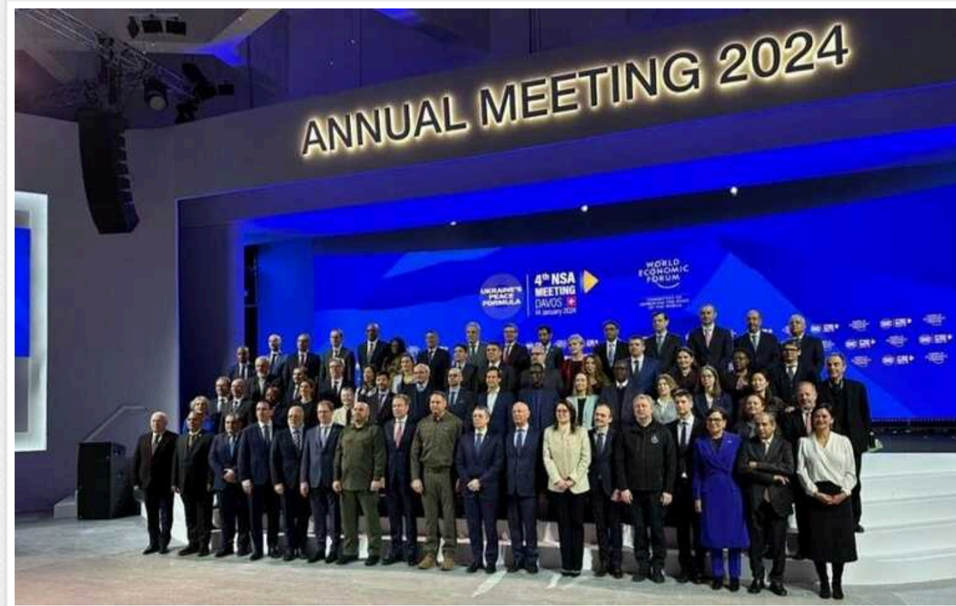
Bloomberg: Переговори щодо української Формули миру у Давосі завершилися без чіткого результату

Четвертий раунд дискусій щодо сталого та справедливого миру в Україні, який пройшов 14 січня у Давосі, завершився без чіткого плану.