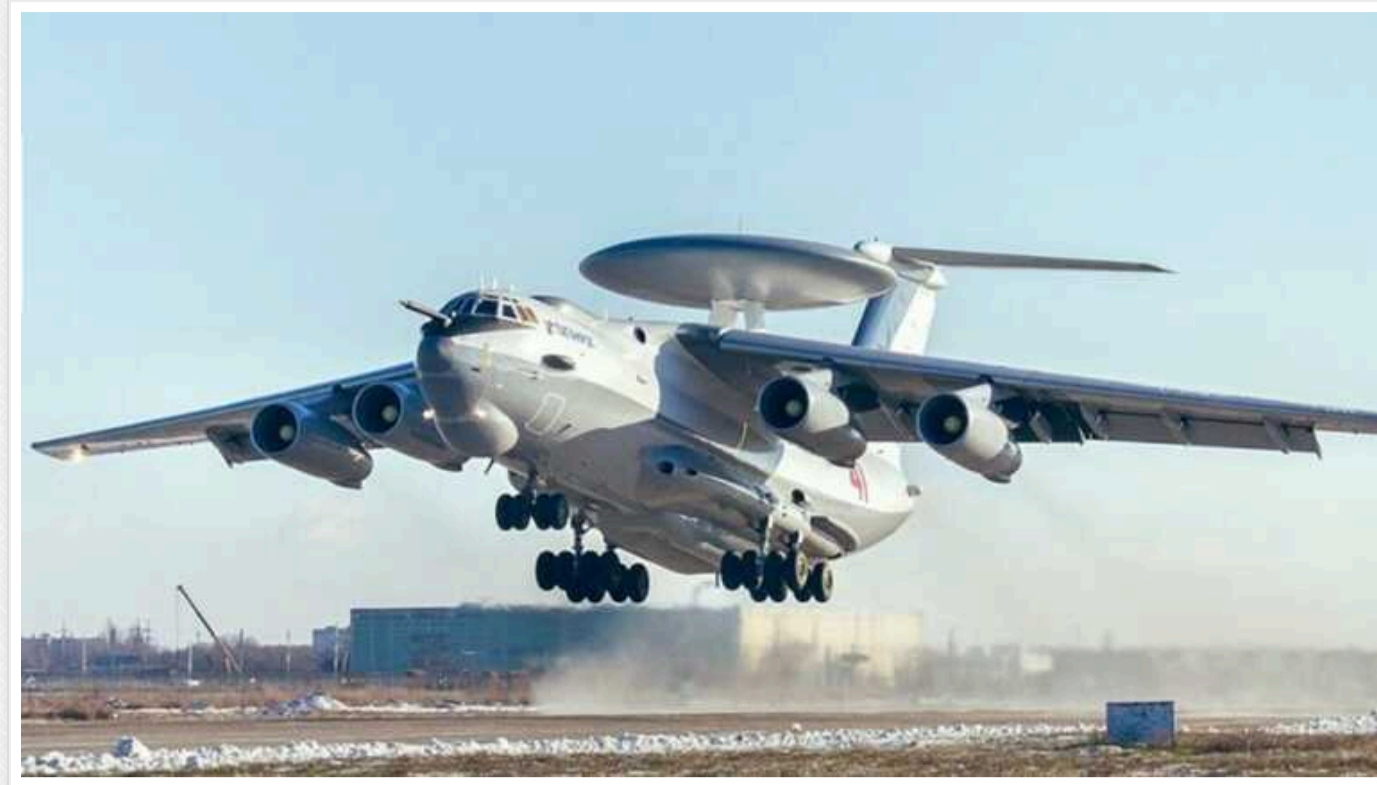
ЗСУ поки офіційно не підтвердили збиття двох російських літаків над Азовським морем

В Україні поки що офіційно не підтверджували збиття над Азовським морем двох російських літаків – А-50 та Іл-22.