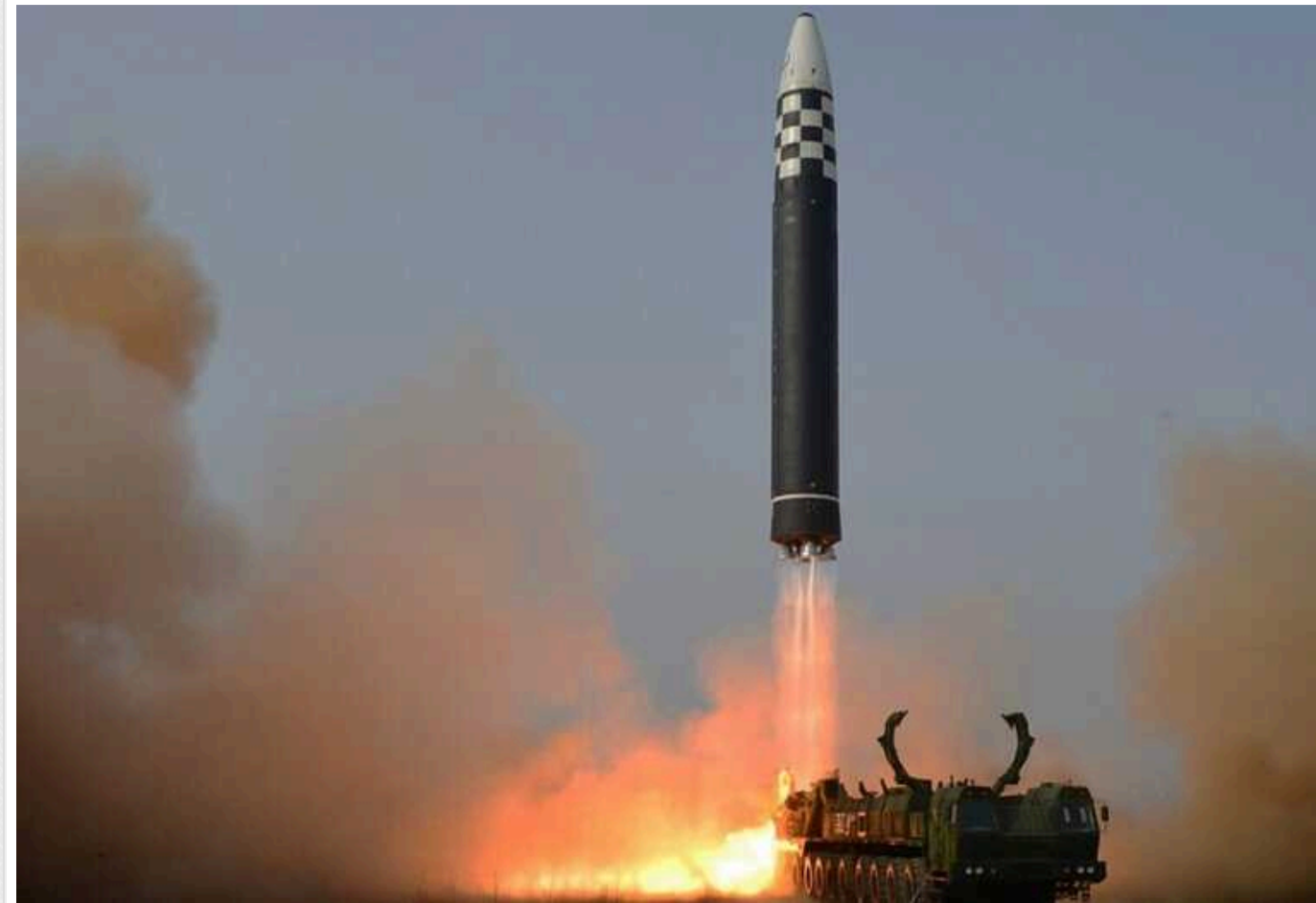
КНДР провела випробування твердопаливної гіперзвукової ракети

Північна Корея 15 січня провела випробування нової твердопаливної гіперзвукової ракети середньої дальності. Випробування визнані успішними.