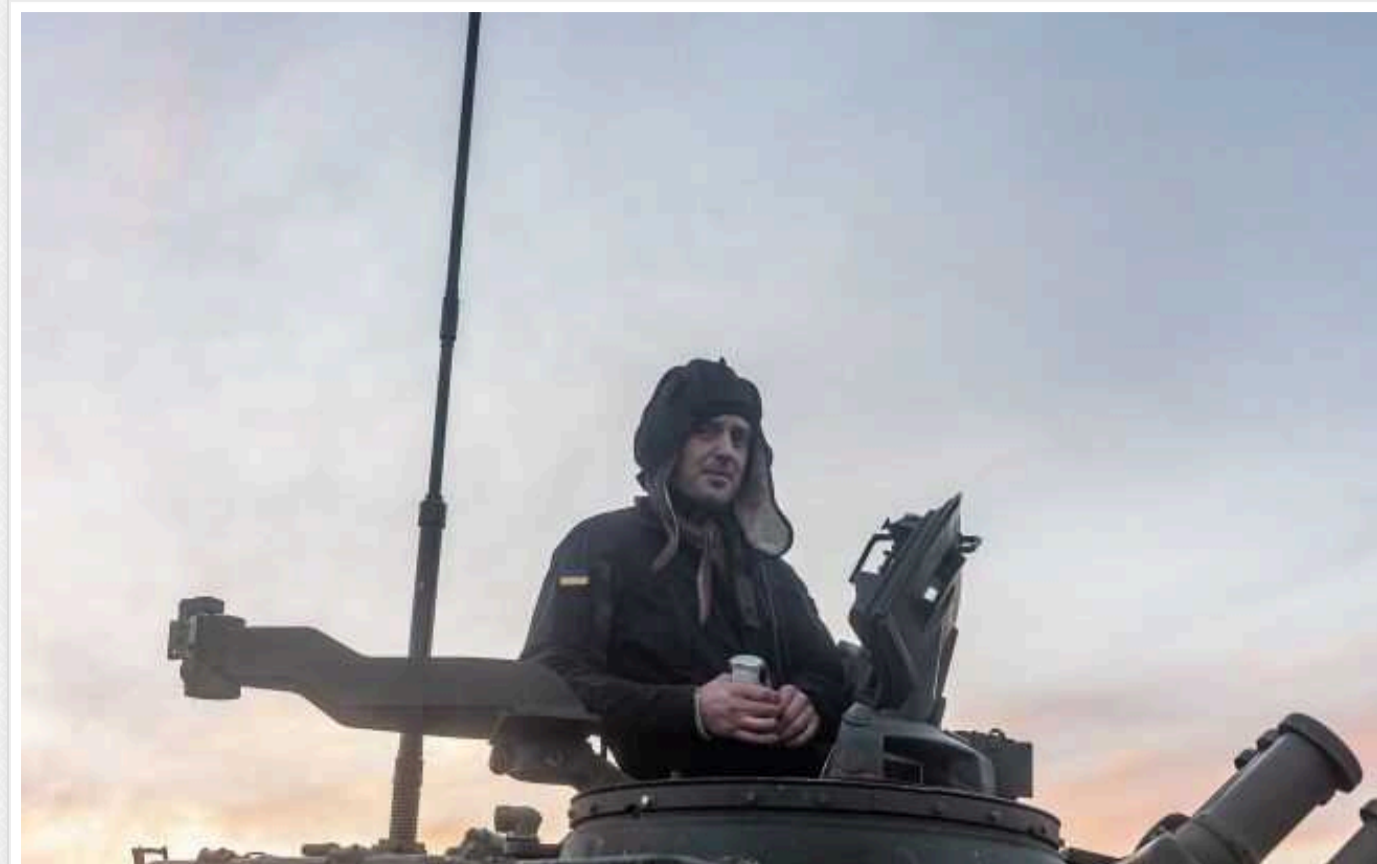
Ситуація на фронті: окупанти постійно атакують поблизу Авдіївки та на південь від Донецька

В Україні на фронті протягом доби сталися 94 бойові зіткнення. Росіяни постійно атакують поблизу Авдіївки та на південь від Донецька.