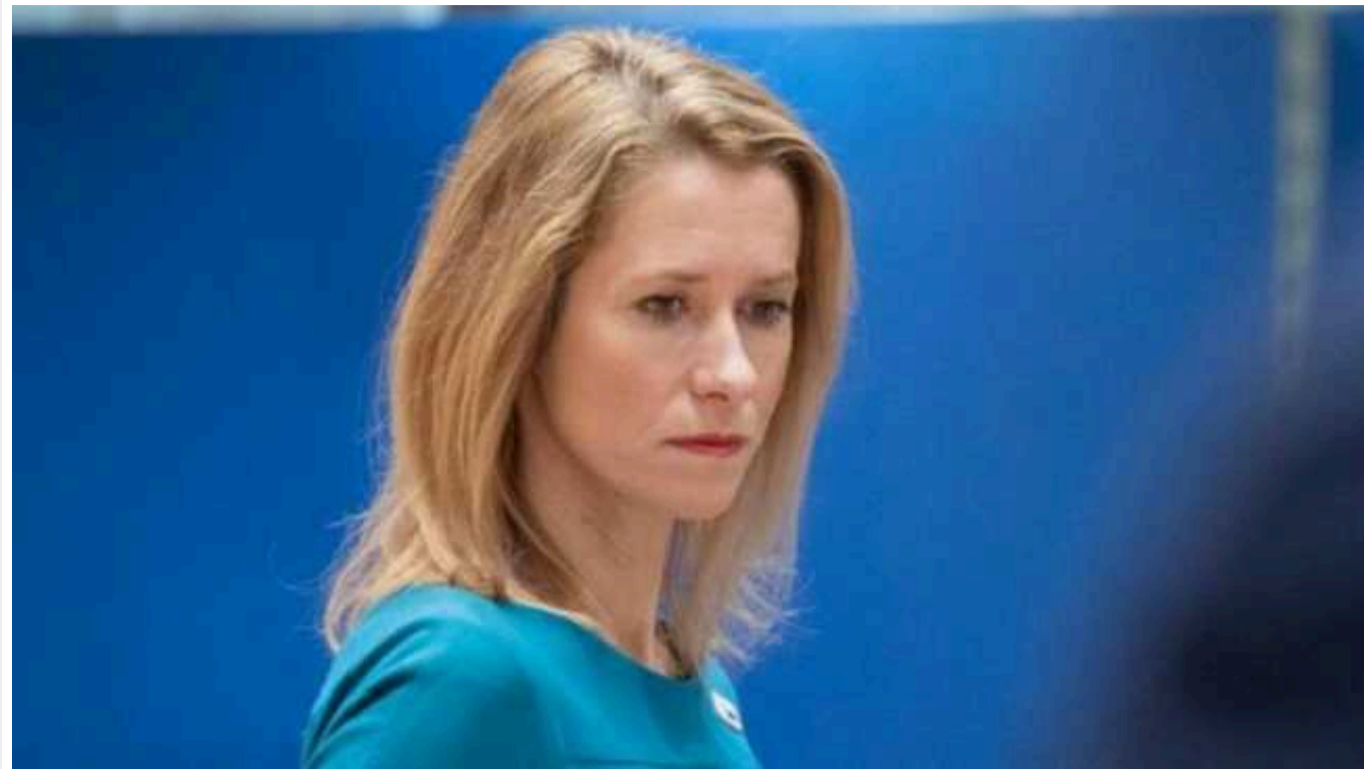
Прем'єрка Естонії Кая Каллас назвала умову, за якої РФ може напасти на НАТО

Якщо країни Заходу не допоможуть Україні перемогти, наступним об'єктом вторгнення може стати Альянс (НАТО).