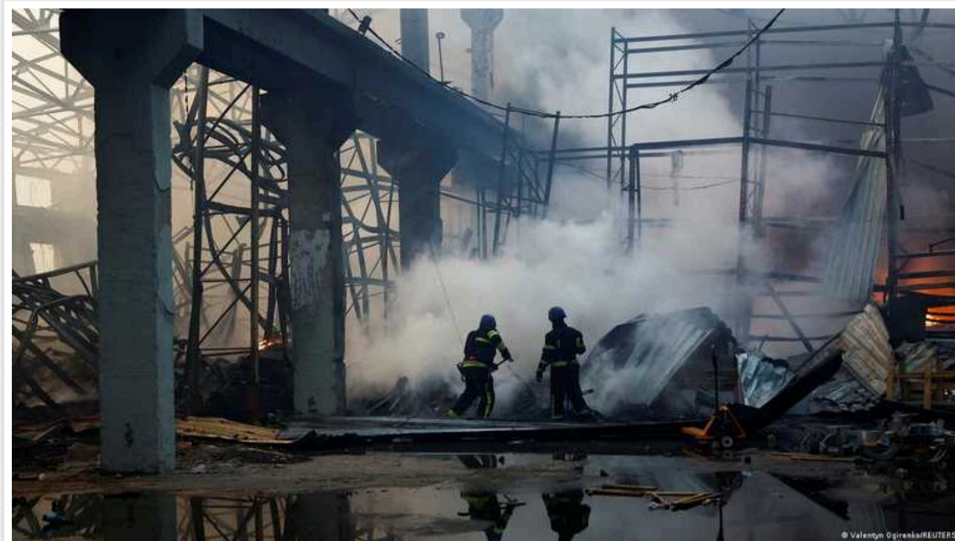
Масштаб і складність останніх повітряних ударів РФ відрізняються від атак минулої зими, - Financial Times

З 29 грудня по 2 січня Росія випустила понад 500 безпілотників та ракет, повідомили виданню чиновники у Києві.