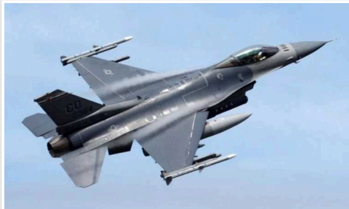
Генерал НАТО назвав критичні сценарії для України через дії Заходу

На думку екскомандувача армією НАТО Філіпа Брідлава, за подальший перебіг війни відповідальні виключно західні політики. Генерал назвав три сценарії, у двох з яких Україна програє.