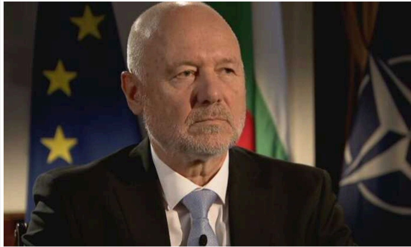
Міністр оборони Болгарії закликав вилучити з підручників з історії інформацію, яка може викликати повагу до Росії

Міністр оборони Болгарії Тодор Тагарьов, який перебуває з п'ятиденним візитом у США, вимагає очистити навчальну програму з історії від "фактів, які викликають повагу до РФ і можуть допомогти оцінити роль Росії в нашому минулому".