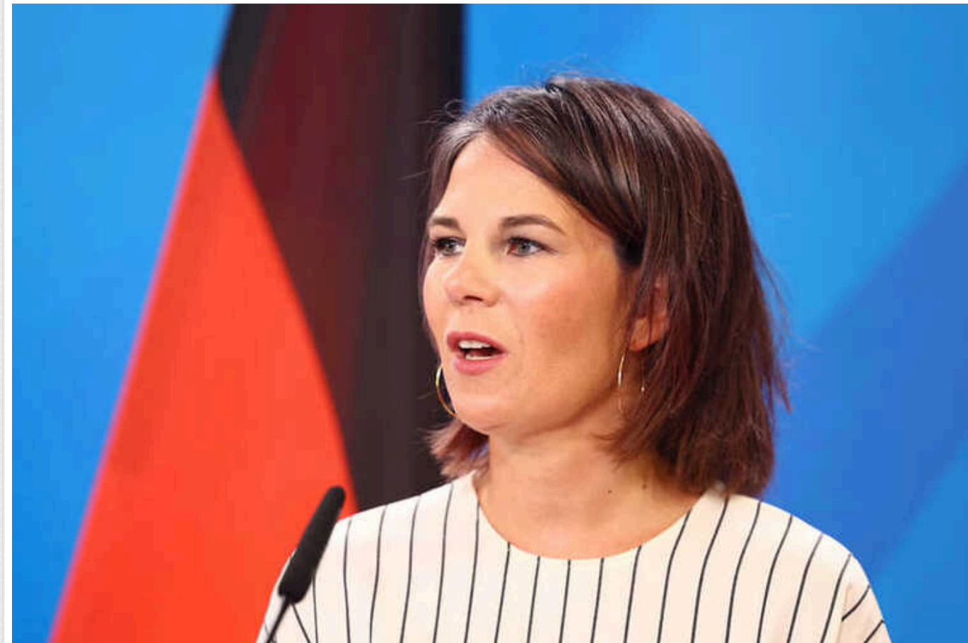
Не здамося, доки заручники не будуть удома - Бербок про війну між Ізраїлем і ХАМАСом

Міністерка закордонних справ Німеччини Анналена Бербок на 100-й день війни на Близькому Сході підтвердила свою надію на звільнення всіх заручників, яких утримує палестинський ісламістський рух ХАМАС.