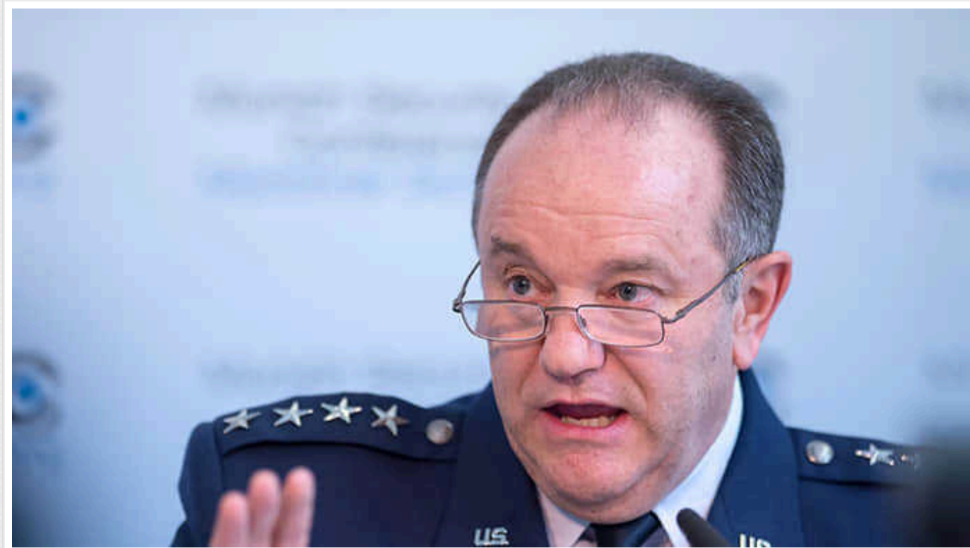
Ми не даємо українцям те, що їм потрібно для перемоги, – генерал США Брідлав

Повномасштабна війна, яку країна-агресор Росія веде проти України, може закінчитися перемогою Києва лише тоді, коли Захід передасть українській армії необхідне озброєння. Зараз західні держави не забезпечують Україну саме тією зброєю, яка потрібна для перемоги.