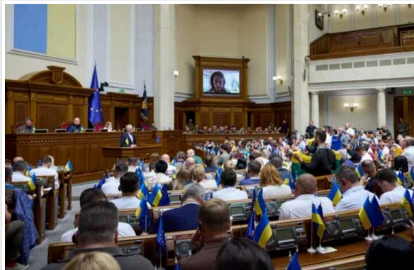
Чи можуть в Україні скасувати броню для депутатів і мобілізувати їх на фронт

Раніше запропонований Верховній Раді закон про мобілізацію мав декілька пунктів, які суперечать Конституції України. Серед них була й пропозиція щодо мобілізації депутатів та держслужбовців. Наразі в Раді напрацьовують альтернативні пропозиції.