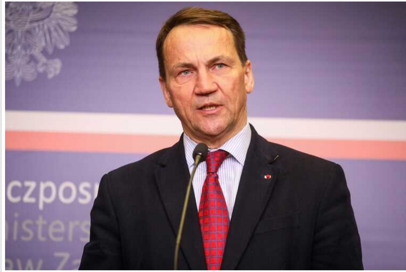
У МЗС Польщі вірять в ухвалення допомоги Україні від США та ЄС незабаром

Глава МЗС Польщі Радослав Сікорський висловив віру у те, що Сполучені Штати та країни Євросоюзу незабаром ухвалять пакети допомоги для України.