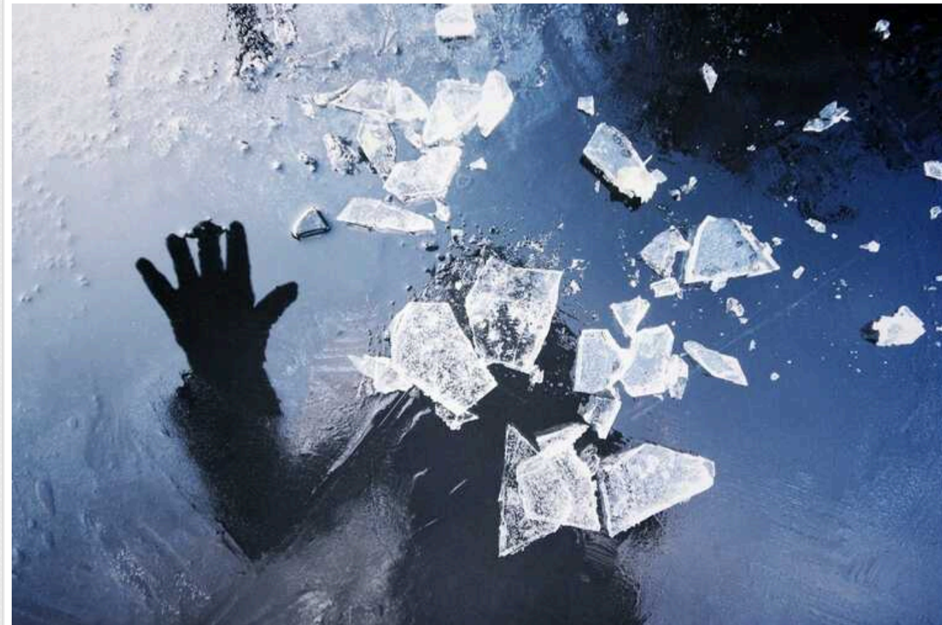
Випадковий герой: чоловік завдяки собачому повідку врятував дітей, які провалилися під лід у Німеччині

У Німеччині випадковий перехожий зумів за допомогою собачого повідка врятувати двох дівчаток, які провалились під лід, коли грались на замерзлому озері.