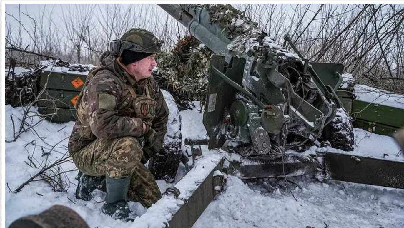
Ситуація на фронті: протягом доби відбулось 86 бойових зіткнень

У неділю на фронті відбулося 86 боекіткнень, на Авдіївському напрямку відбито 22 атаки, на Мар'їнському – 15, на Лиманському – 14.