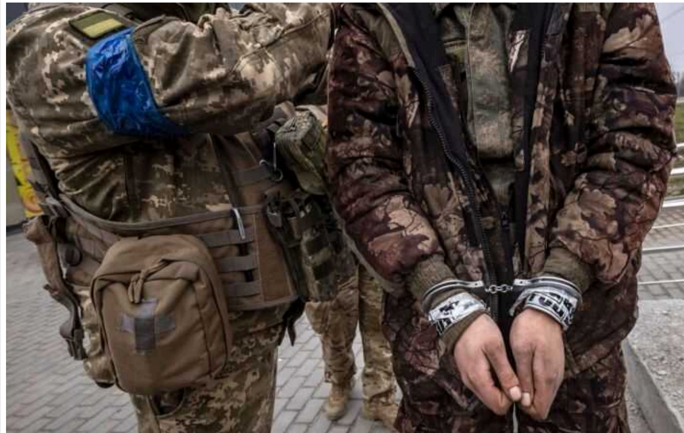
На Запорізькому напрямку ЗСУ "прорідили" три штурмові групи окупантів, залишки взяли в полон

На Запорізькому напрямку знищено чергову групу окупантів, яка намагалася захопити позиції ЗСУ.