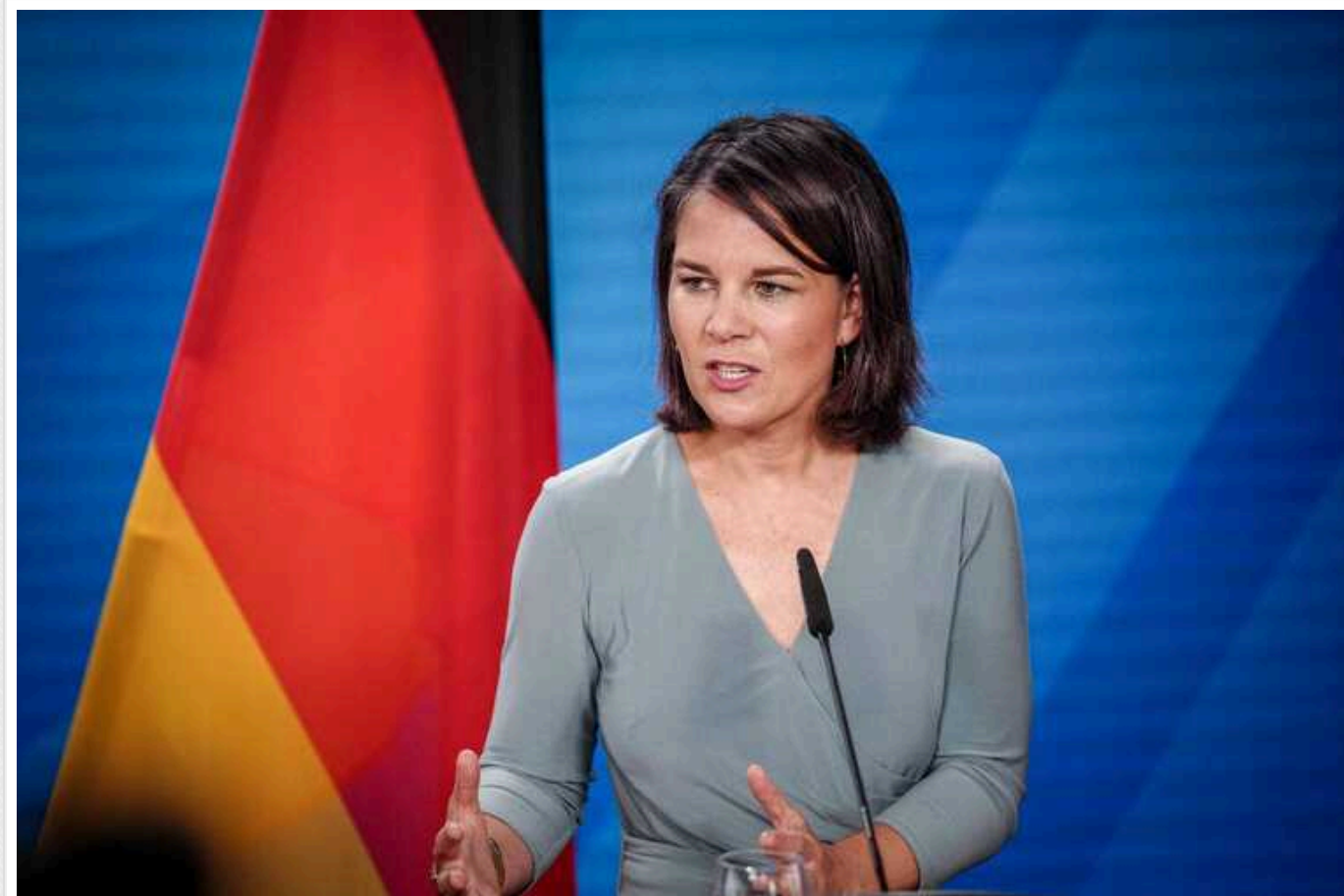
Париж і Берлін стоять разом на боці України, - Бербок

Німеччина та Франція будуть продовжувати стояти на боці України, тим більше, чим більше Росія буде чинити свою беззаконня проти українців.