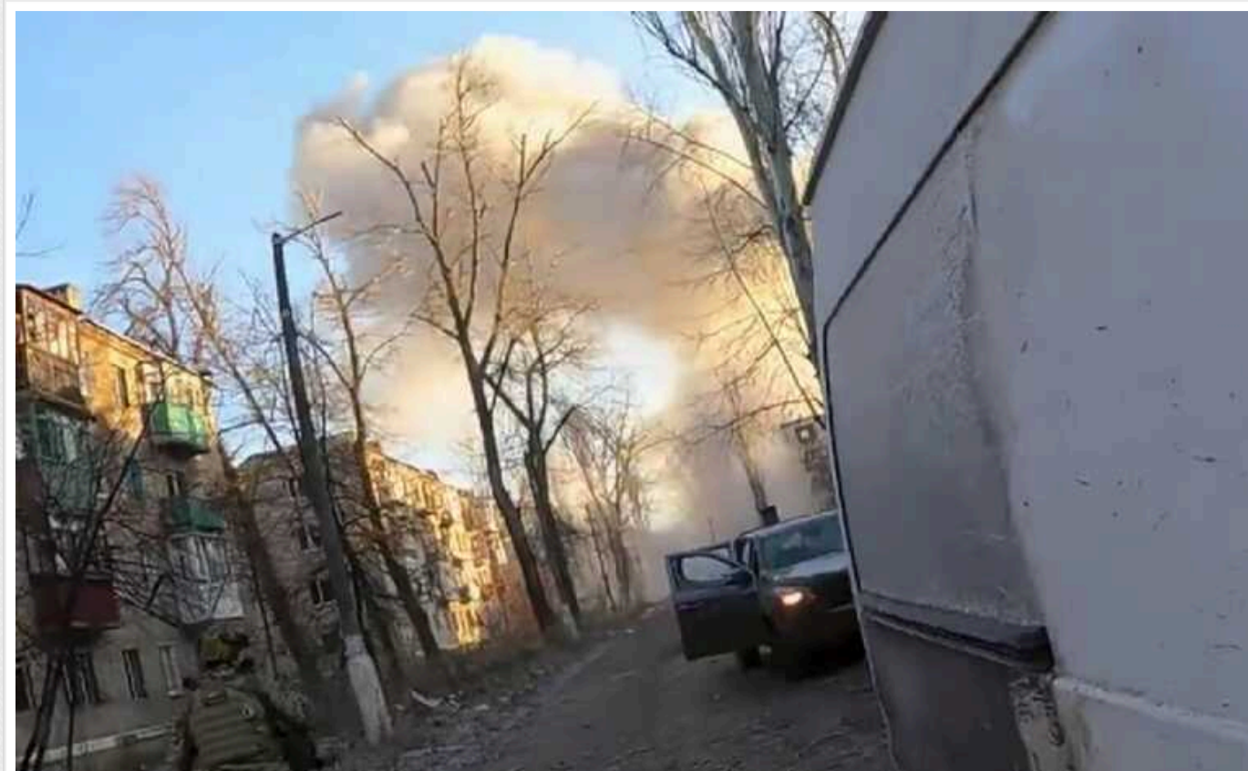
Окупанти завдали удару дронами по поліцейським, які рятували поранених жінок в Авдіївці

Російські військові атакували дронами правоохоронців в Авдіївці на Донеччині. У цей момент вони допомагали пораненим жінкам.