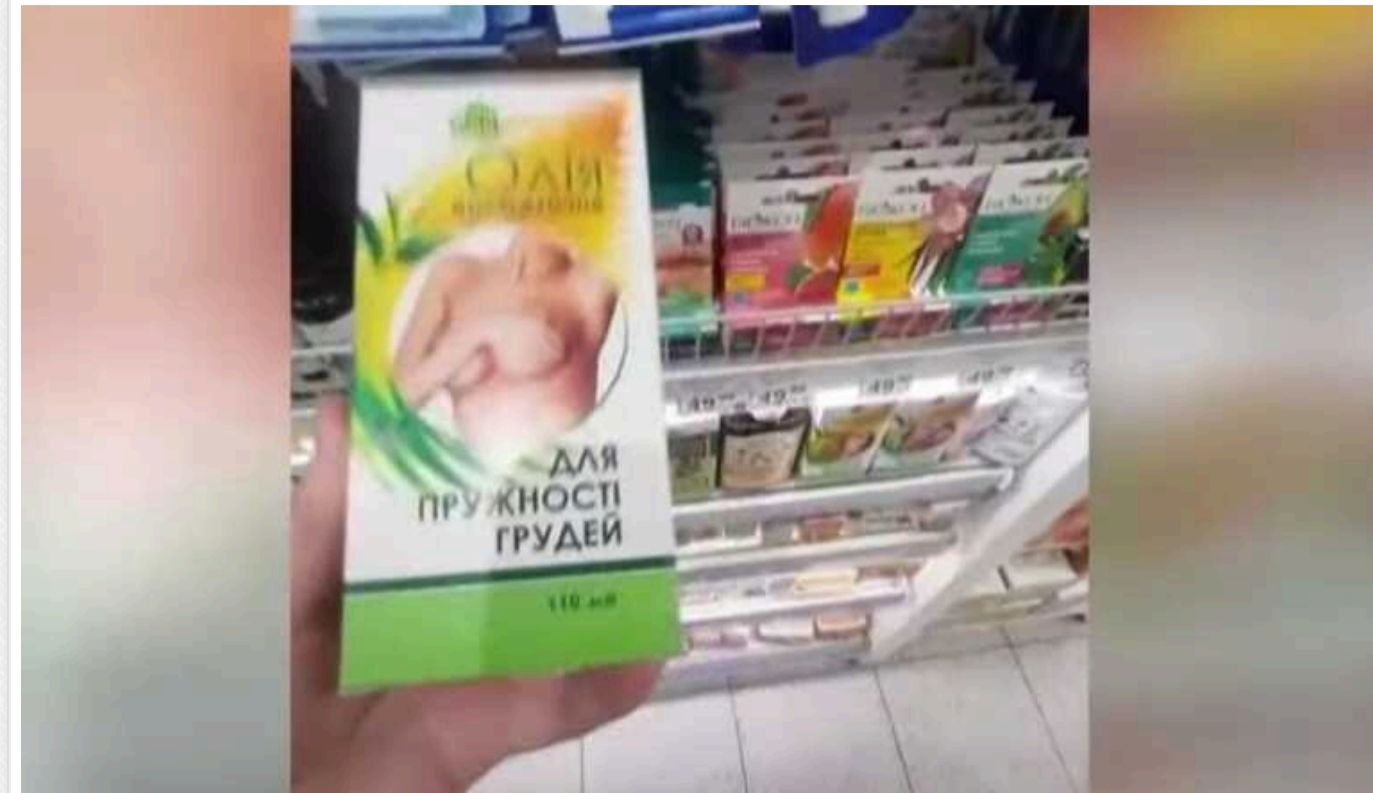
Жителька Луцька ледь не загриміла за ґрати на 5 років через "пружні" груди

Волинянка ледь не загриміла за ґрати на 5 років через те, що хотіла зробити собі пружний бюст. А точніше, таке покарання нависло над нею за 2 креми і олійку для пружності грудей, які та поцупила із полиць в супермаркеті.