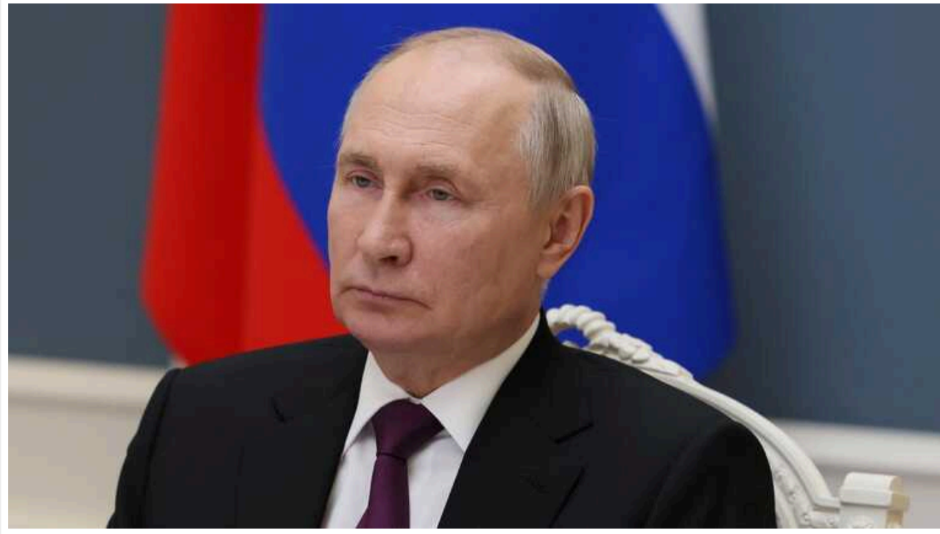
У США прорахували загрозу іншим країнам: Путін не зупиниться

Якщо Путін зможе здобути хоча б незначну перемогу в Україні, наслідки будуть жахливими для Європи та решти світу.