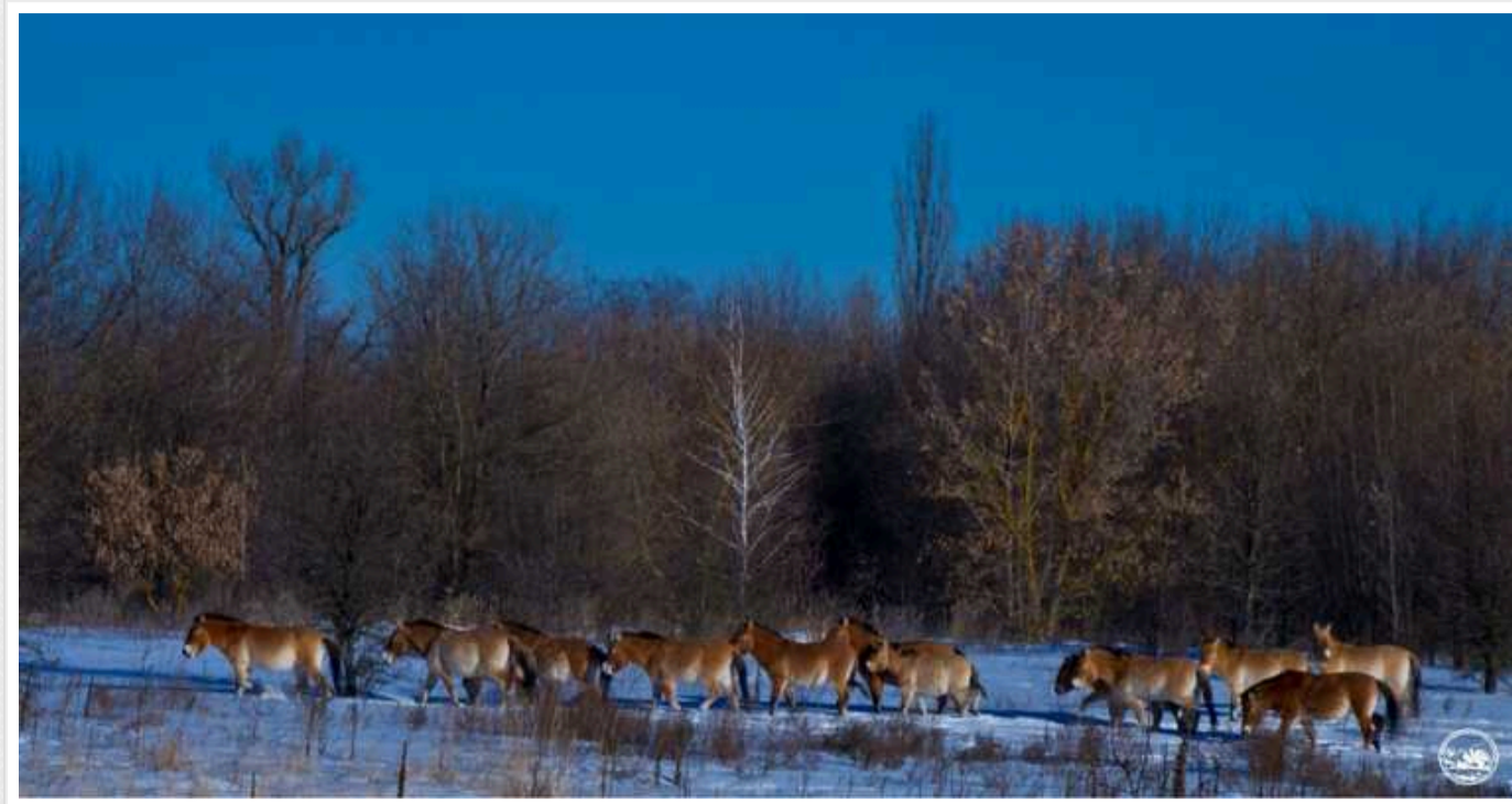
Російська агресія завдала природно-заповідному фонду Київщини збитків на 382 мільйона гривень

За час повномасштабного вторгнення РФ збитки, які були завдані внаслідок військової агресії природно-заповідному фонду на Київщині, перевищують 382 млн гривень. Найбільше постраждала Чорнобильська зона, де велику шкоду завдали не тільки підпали території, а й риття окопів, яким здійняли в повітря чимало радіаційного пилу.