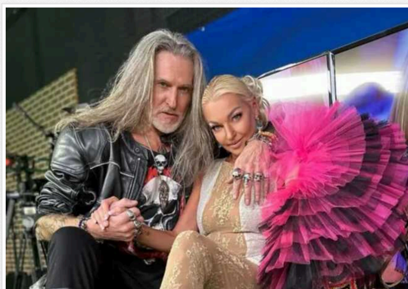
Z-патріоти Джигурда та Волочкова влаштували п'яні танці з роздяганням

Російський актор і виконавець родом із Києва Нікіта Джигурда, а також балерина Анастасія Волочкова у стані сильного алкогольного сп'яніння влаштували гонейні танці та зафіксували це все на відео. Артисти, які є затятими фанатами путінського режиму й терористичної війни, стали посміховиськом серед свого ж народу.