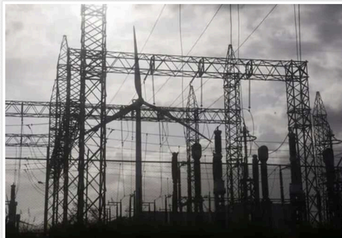
У Мережі поширюють фейки про відключення світла та тепла

У соціальних мережах ширяться неправдиві дописи про начебто "катастрофічну ситуацію в українській енергетиці" й відключення електроенергії та теплостачання. Однак такі повідомлення є фейками та не відповідають дійсності.