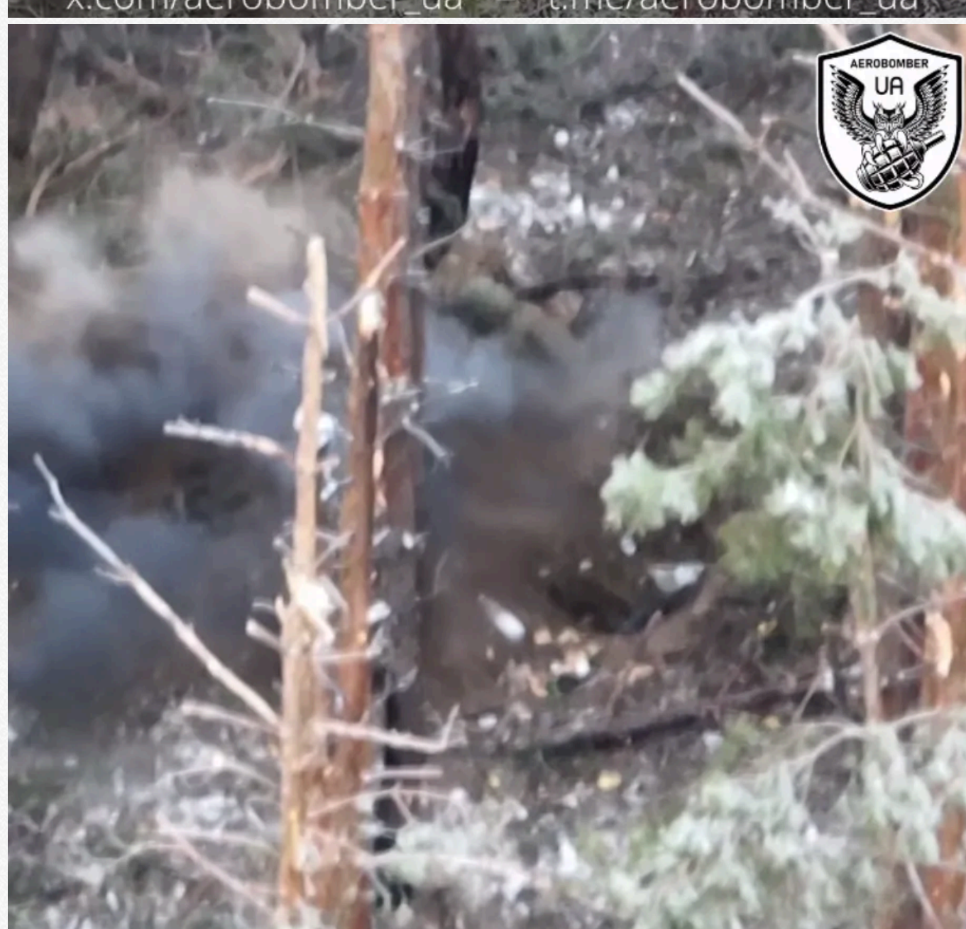
x.com/aerobomber_ua = t.me/aerobomber_ua

Інші ж натакю на те, що в Україні їм не раді, не зрозуміли: поскоплювавшись на ноги, вони спробували збити дрони українців з вогнепальної зброї. Однак укрита у вигляді тонких сосен, за якими намагалися сховатися досить вдовані кадристи, виявилися поганим прихистком від ударів з неба: за підсумками "протистояння" втрат у загарбників побільшало.