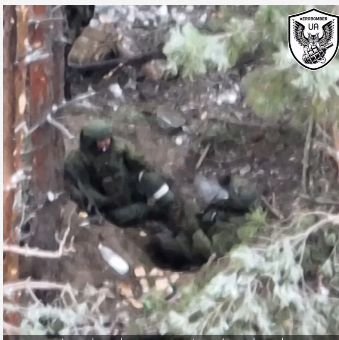
x.com/aerobomber_ua = t.me/aerobomber_ua

На відео видно, як група окупантів сидить в українському лісі поблизу викопаного бліндажа. Почуваються загарбники явно розслабленими, один неквапно курить, схилившись на дерево.