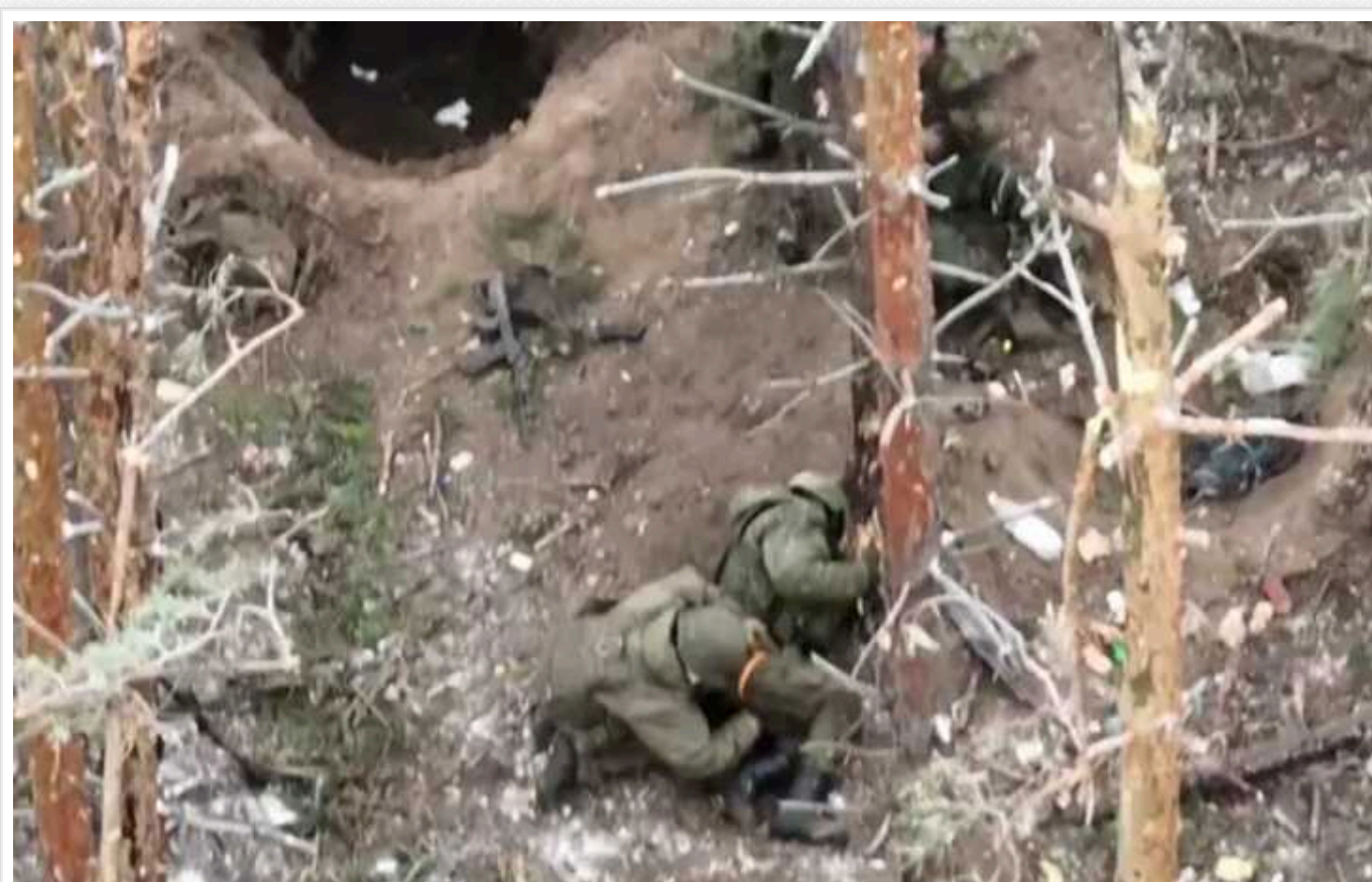
Оператори-дронів натрапили на засідку ворога і змусили його пошкодувати про "зустріч"

На одному з напрямків фронту українські аерозвідники виявили шовков окупантів-кадристів і атакували їх з дронів. Попри те, що кілька загарбників отримали поранення, решта натакю не зрозуміла і спробувала збити надкошучиву українську "пташку" з вогнепальної зброї.