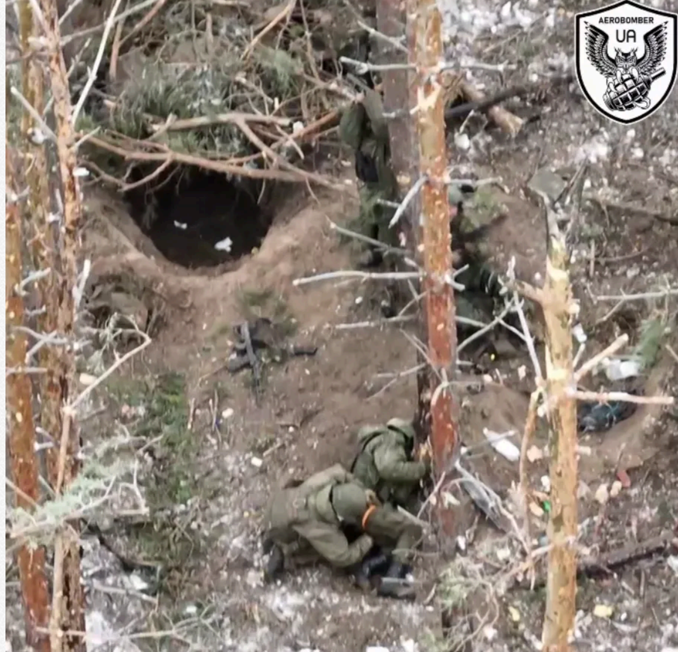
x.com/aerobomber_ua = t.me/aerobomber_ua

Інші ж натакю на те, що в Україні їм не раді, не зрозуміли: поскоплювавшись на ноги, вони спробували збити дрони українців з вогнепальної зброї. Однак укрита у вигляді тонких сосен, за якими намагалися сховатися досить вдовані кадристи, виявилися поганим прихистком від ударів з неба: за підсумками "протистояння" втрат у загарбників побільшало.