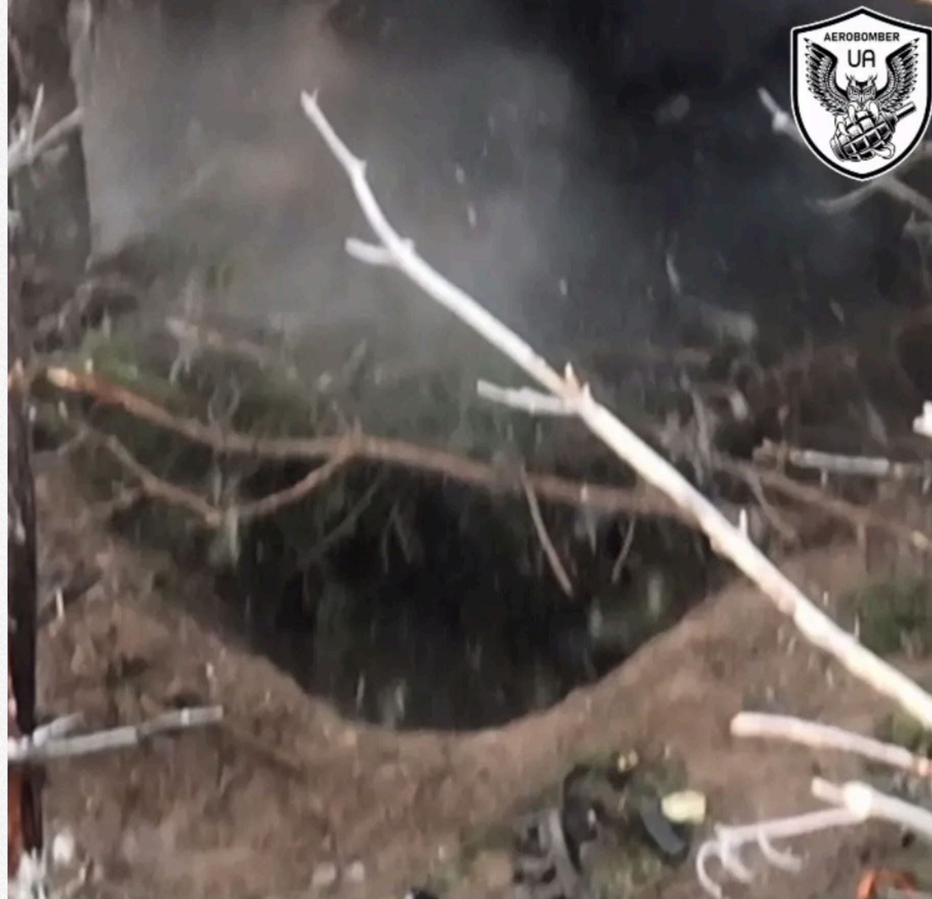
x.com/aerobomber_ua = t.me/aerobomber_ua

Ті ж, кого одразу ліквідувати не вдалося, вирішили, що зможуть сховатися від відплати у викопаній у землі норі – зрештою вона стала для них могилою.