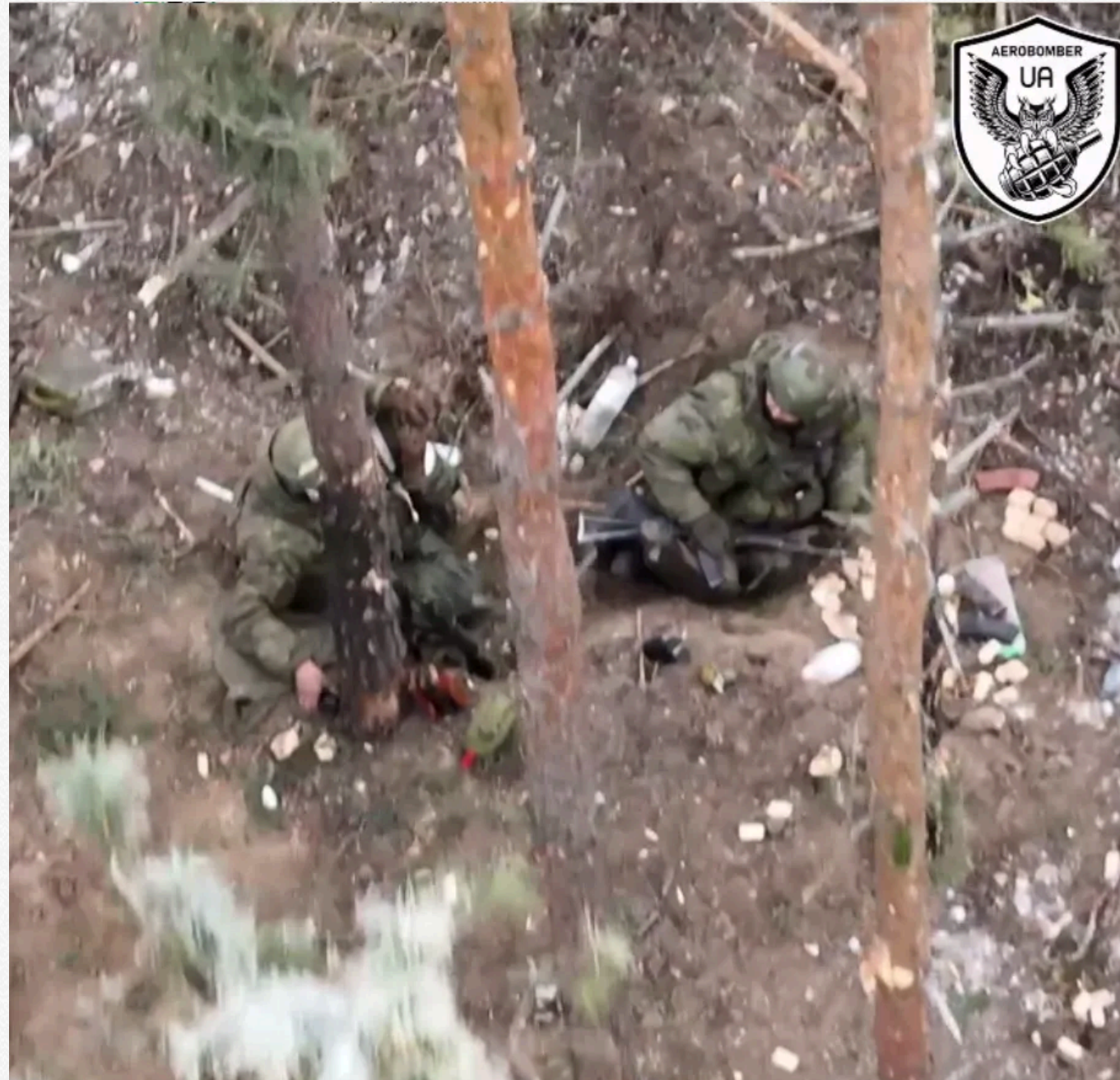
x.com/aerobomber_ua = t.me/aerobomber_ua

Меланхолію загарбників вирішили розвіяти оператори групи ударної розвідки 30 ОМБр, які зробили кілька скидів з БЛЛА прямо на голови окупантам. Скиди виявилися влучними: щонайменше двох кадристів були поранені.