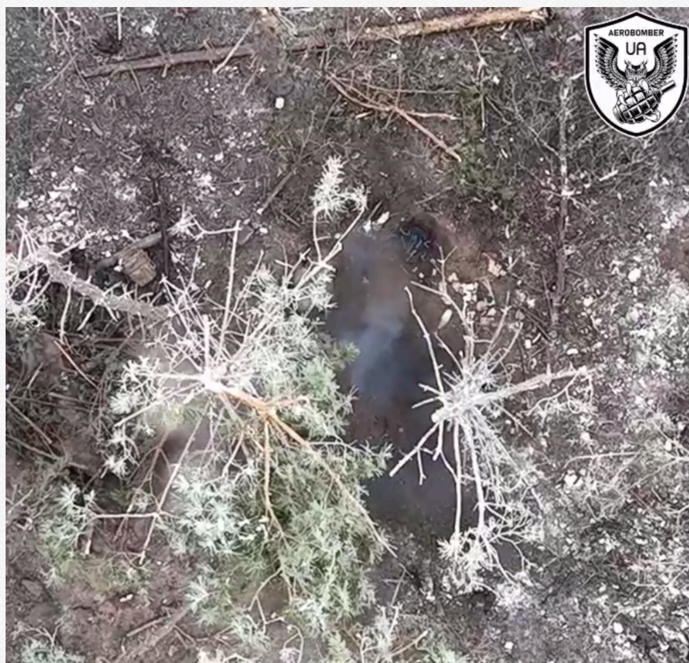
x.com/aerobomber_ua = t.me/aerobomber_ua

Меланхолію загарбників вирішили розвіяти оператори групи ударної розвідки 30 ОМБр, які зробили кілька скидів з БЛЛА прямо на голови окупантам. Скиди виявилися влучними: щонайменше двох кадристів були поранені.