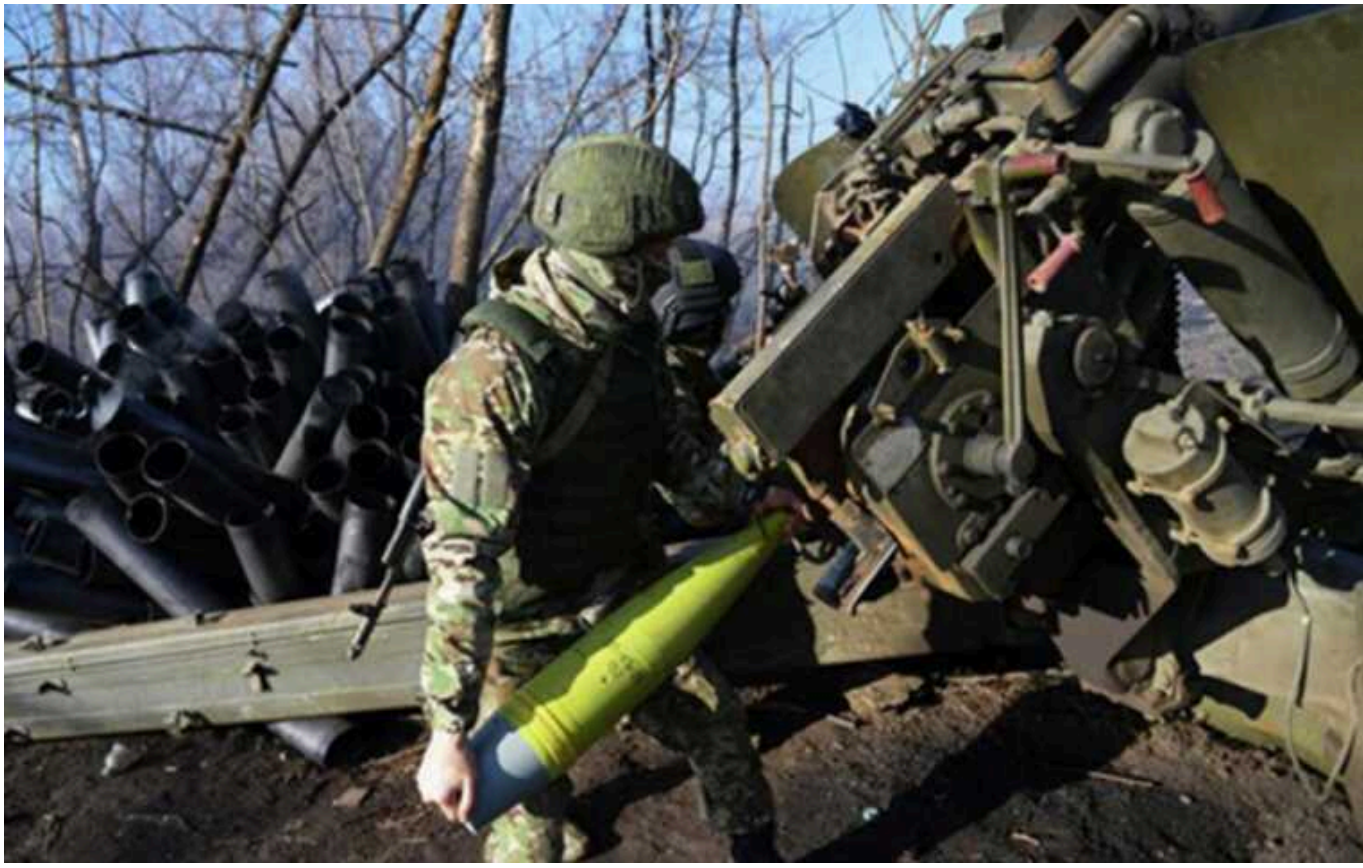
"Окупанти підтягнули резерви": в ЗСУ розповіли про ситуацію на лівобережжі Херсонщини

Росіяни на лівобережжі Дніпра у Херсонській області збільшили контингент професійних військових – морських піхотинців та десантників. Водночас розбрат всередині окупаційної армії заважає їм досягати поставлених цілей, внаслідок чого ворог втрачає впевненість у власних діях.